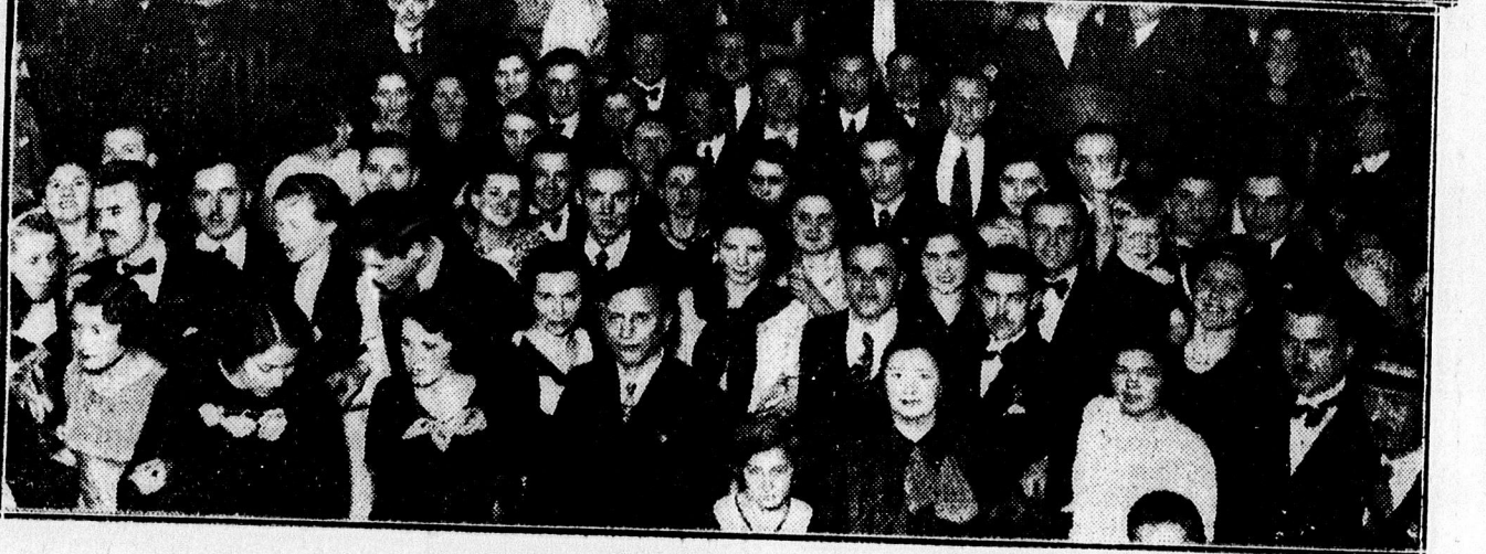
KÉPEK A BALOZÓ DEBRECENRŐL. Fent: a városi tisztviselők estélyéről. Középen: a Kalászgárda műsoros táncestélyéről. Lent: a Dohánygyári Dal és Sport Egylet mulatságáról.