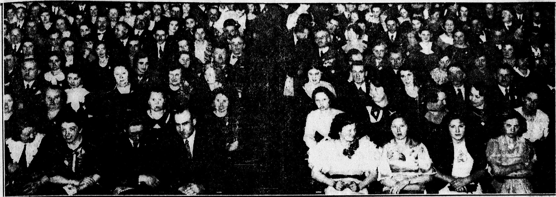
A frontharcosok estélyéről. (A közönség egyrésze.)