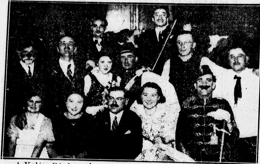
A Kalász Garda műkedvelői nagy sikerrel szerepeltek.