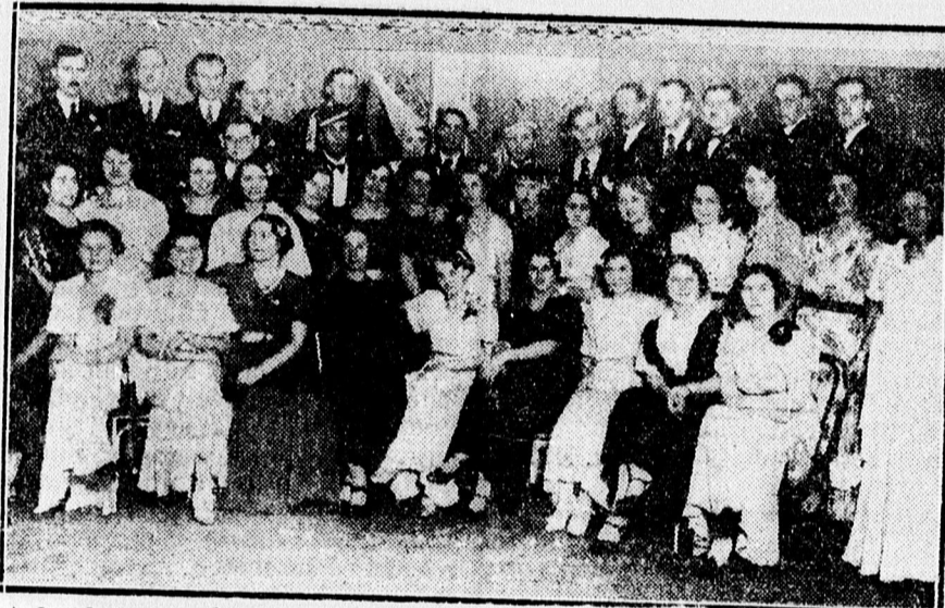
A hajduszoboszlói egyetemi ifjúság jótékony célú „Hóvirág”-bálla-nak táncos csoportja.