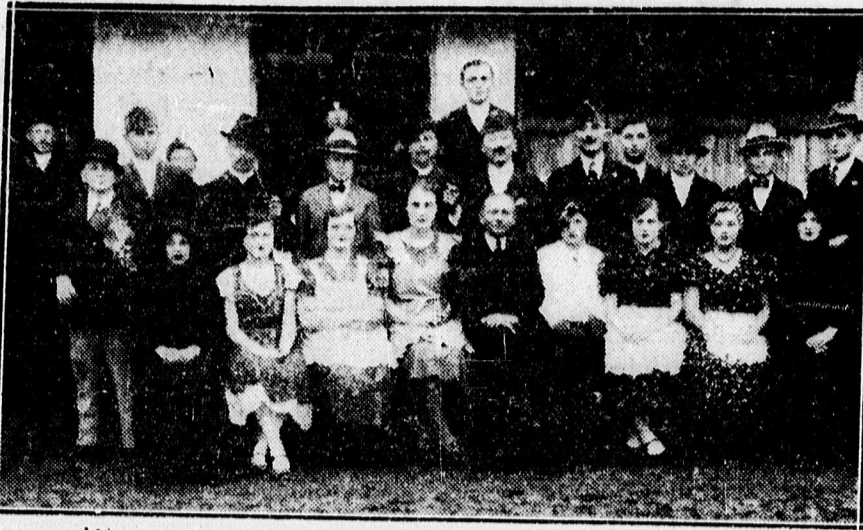
A nagylétai ref. gazdálkodó ifjúság műsoros estéjével egybekötött táncmulatságának szereplői.

— Nyugalmozott MÁV főtisztviselők összejövetele. A m. kir. államvasutak Debreczenben és környékén lakó nyug. főtisztviselőinek szokásos havonkénti összejövetele az Angol Királynő zöldtermében, március hó másodikán, hétfőn este hat órakor lesz. A rendezőség kéri az érdekelteket, hogy a hétfő összejövetele a megszokott nagy számban szíveskedjenek megjelenni.