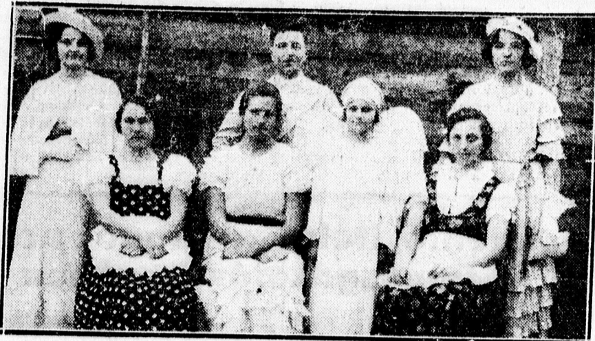
A Balmazújvárosi Iparoskör által rendezett műkedvelő előadás szereplői. Színterület a „Buzavirág” c. színmű.

x Fogorvoslás, Piac ucca 5. szám. Tömés 2 pengő, műfogak 2 pengőtől, foghúzás díjtalan. Davidovits áll. sziszegott fogász.