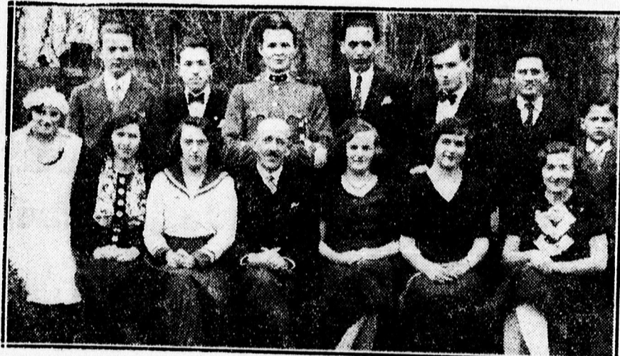
A Balmazújvárosi Ref. Kiskör által rendezett műkedvelő előadás szereplői.