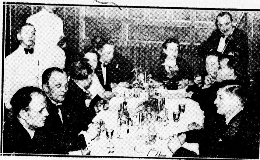
Képek a vendéglős bátról

talál. Városháza sarkán. — Győződjön meg mélyen leszállított árainról!