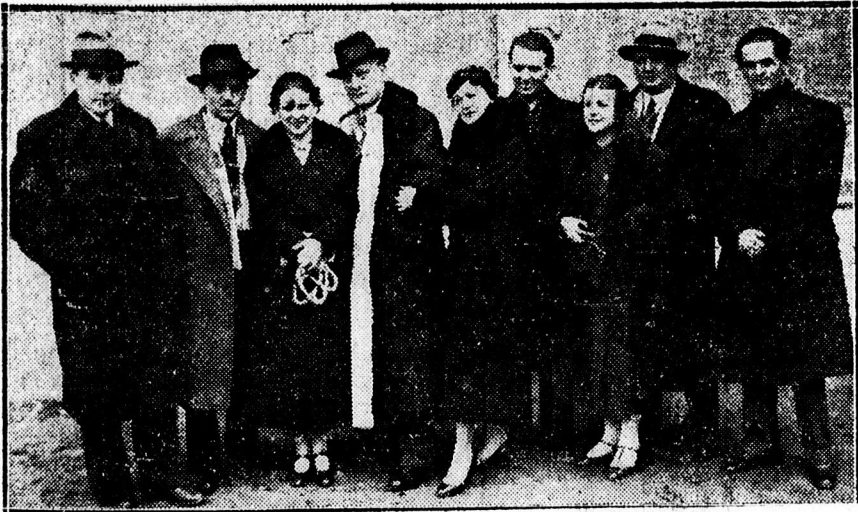
Beregi Oszkár a debreceni színészekkel.

vészélet pazar alakítások tömegét dobta ki magából s olyan művészi meglátásokat teremtett a színpad deszkáira, amilyent kevés kortárs az európai színházgárdából. A békevilág légkörében kiteljesedett tehetség a Beregié és mégis kevés színésznő van, akinek alakításában annyira benne dobolna a maga láza ütemével ez a nyugtalan, hasadozott lelki kor s akinek játéka annyira megtudná teremteni azt a delezés áramot, forró atmoszférát, nézőtér és színész között, mely már több mint a siker kivirágása, mert személyes ügyvé, élményévé avatja a publikumnak azt, amit elé varázolt egy szinte mágikus művész