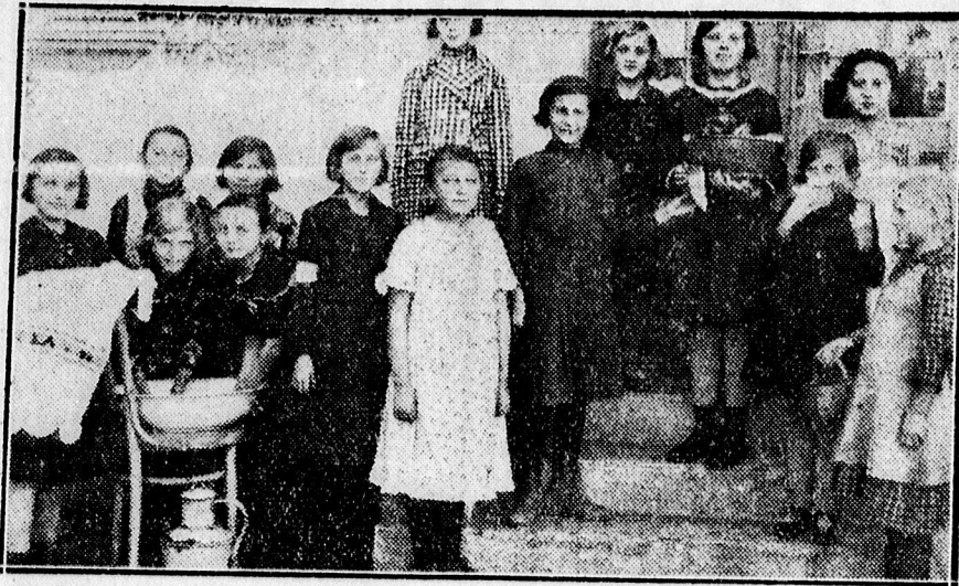
Kabán a szegény gyermekeknek uzsonnát adnak, de uzsonnát csak az kap, aki evés előtt a kezét jól megmossa.

x Komárominé Inectóval, Hennával fest, Elrontott, kiszáradt hajakat teljesen rendbehoz párisi olajgőzkezeléssel. — Olajdauér, Paróka készítés, Bikabérbáz, Telefon: 19-56. szám.