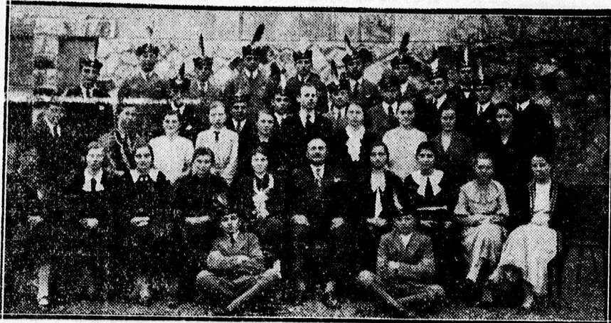
A berettyóújfalui téli gazdasági iskola által rendezett „Napraforgó” népszin- mű előadása során szereplők.