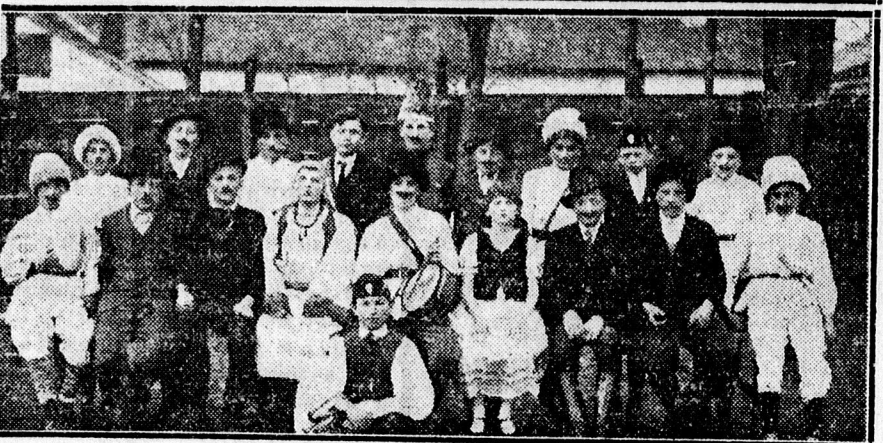
FENT: A balmazújvárosi áll. polg. fiu- és leányiskola III. és IV. oszt. leány- növendékek által előadott történelji kép szereplői.