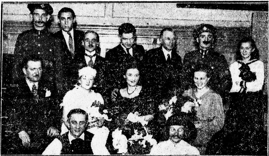
Kereskedelmi alkalmazottak március 15-i ünnepélyének szereplői.

— Elmarad az Ady Társaság mai előadása. Az Ady Társaság tanfolyamán a mai, szerdai előadás elmarad a terem elfoglaltsága miatt.