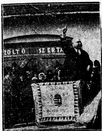
Maday Gyula országgyűlési képviselő beszél a balmazújvárosi március 15-iki ünnepélyen.

Ünnepélyes keretek között ünnepelték meg a március 15-ikét Balmazújvároson is. Ünneplőessé tette a hangulatot a balmazújvárosi Nép-körök tagjainak zenés felvonulása a nemzeti lobogóval. Az ünnepélyt a község háza udvarán tartották, sok ezer ember jelenlétében. Kezdődött a nemzeti ima éneklésével, melyet a Balmazújvárosi Dalárda adott elő. Utána Ifj. Hüsi A. a „Talpra magyar” c. költeményt szavalta el. A város apraja nagyja ott volt az ünnepélyen és figyelemmel hallgatták Maday Gyula országgyűlési képviselő lelkes halású beszédét. — Azután Pálfi János egyetemi hallgató szavalt, majd ismét a dalkör alkalmi dala következett. Az ünnepély a nemzeti ima hangjai mellett zárult be.