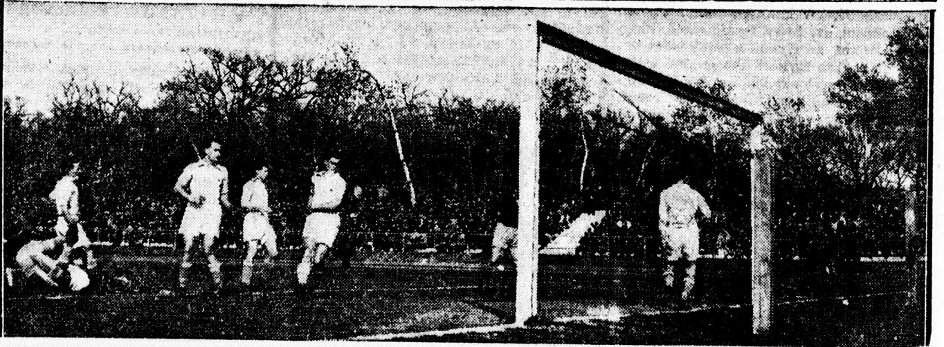
Teleki mesteri gólja a Törekvés hálójában.

A Bocskai 8 : 0-as győzelem után felsorakozott a pályán s úgy vett