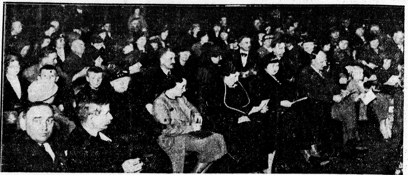
A „cserei pacisrták” nagysikerű előadást tartottak vasárnap. — Képvünkön az ünnepély előkelő kö- zönsége.

x BOROS szépen s jól fest, olcsón, mos, tisztít. Plac ucca 77.