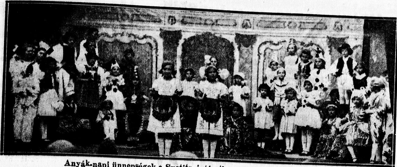
Anyák-napi ünnepségek a Svetits intézetben. — A szereplő babák.