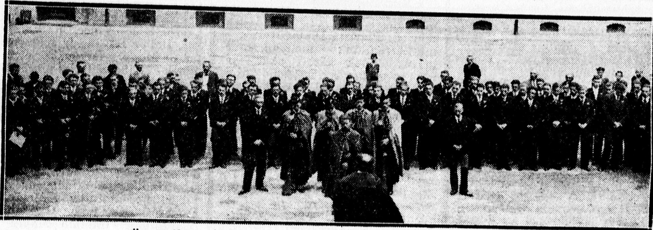
Ünnepélyes tanévvége a ref. főgimnáziumban. A diákság.