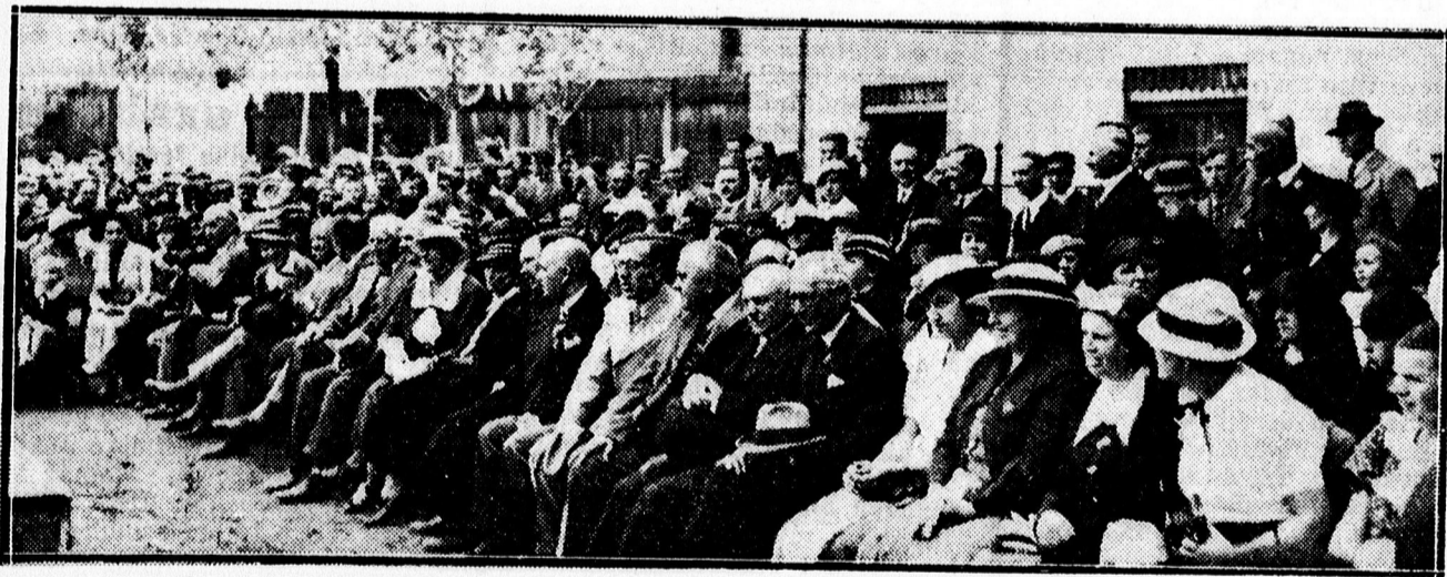
A közönség egyrészé.