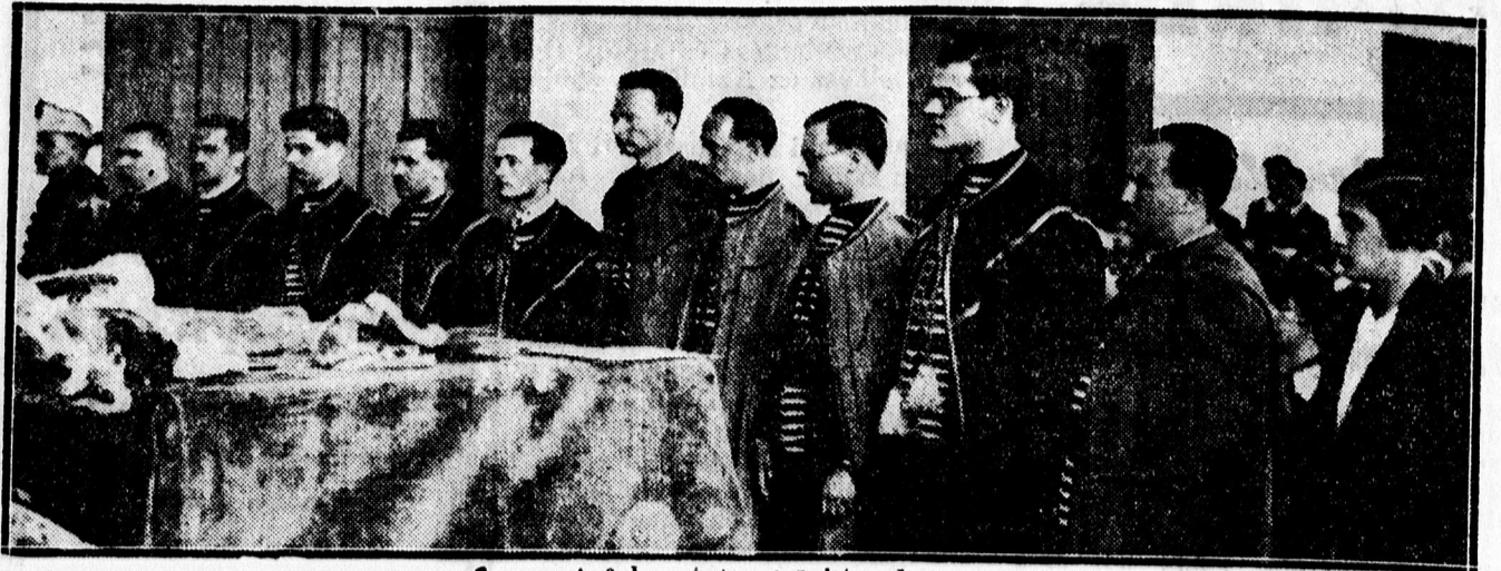
A felavatott új doktorok.