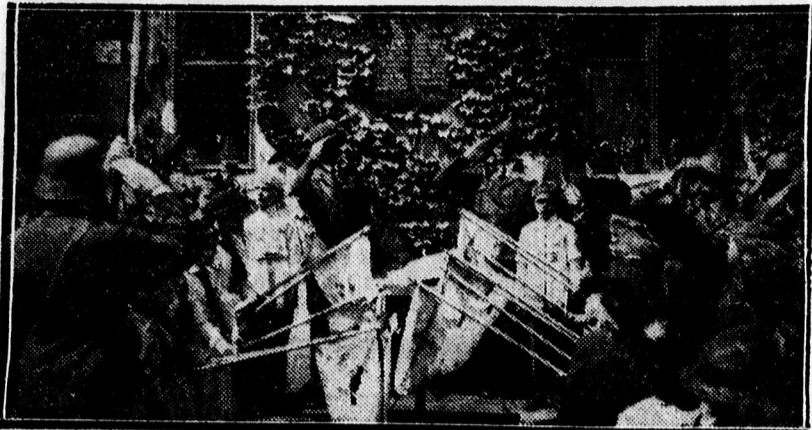
Az evang. elemi iskola hősi halottai emléktáblájának leleplezése

— Vasárnap délután nyitotta meg az Ujságírók Clubja a Kereskedelmi Csarnokkal közösen új nyári helyiségét a nagyerdői vígadó erre a célra külön elkerített udvarán. Népes közönség vett részt a megnyitón és rövidesen megalakultak a bridge és rómi játszmák. A közönség szívesen vette a nyári helyiség megnyitását. Jó idő esetén a játék állandóan kint lesz, rossz idő esetén a városi helyiségben, amely különben állandóan nyitva van és üzemben.