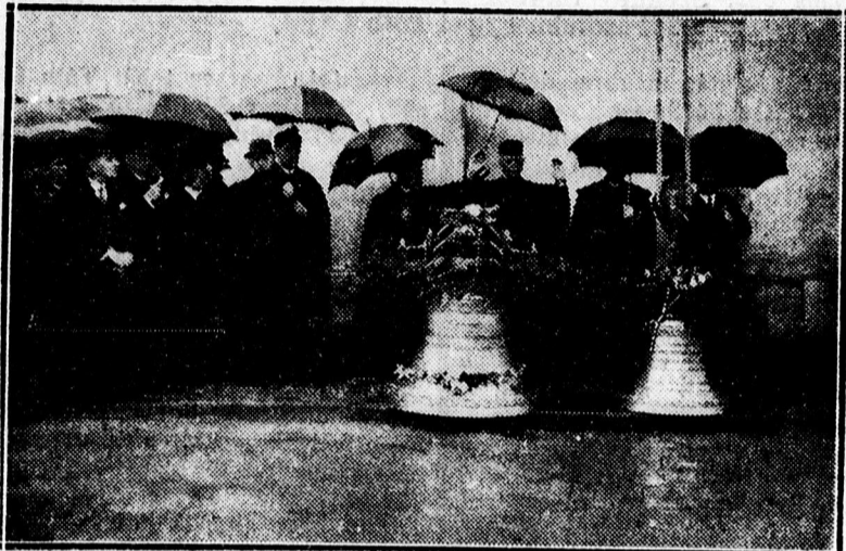
Baltazár Dezső püspök megáldja az Ispotályi templom új harangjait.

— A borbély, férfi- és nőifodrász, valamint kozmetikus szakosztály ma, azaz kedden este fél 8 órai kezdettel az ipartestület tanácstermében fontos ügyekben szakosztályi ülést tart. — A tagok teljes számú és pontos megjelentését kéri a szakosztály elnöksége.