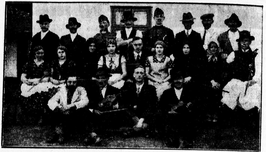
A biharmegyei Bánd községben nagy sikerrel adták elő „Arva Rózi” népszínművet. A kép a darab szereplőit ábrázolja.