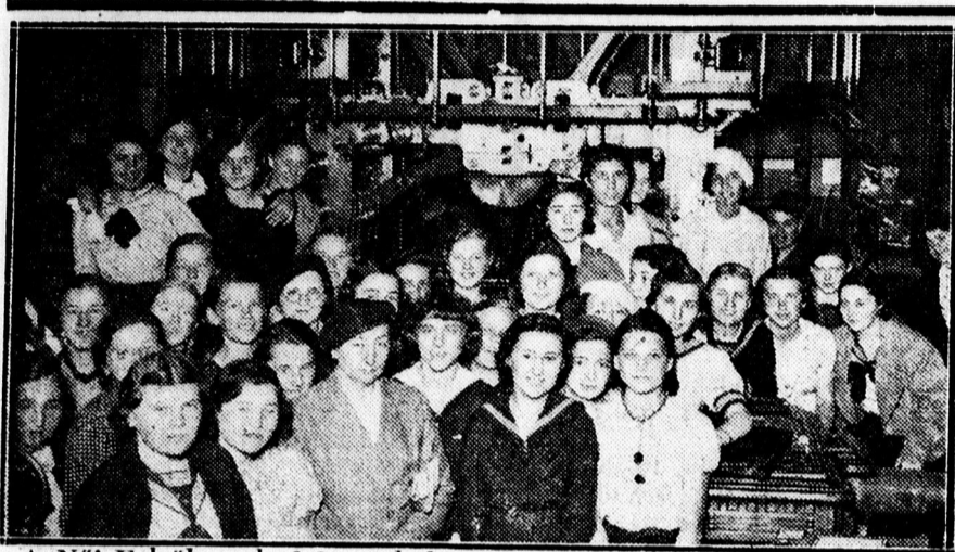
A Női Felsőkereskedelmi iskola növendékei lapunk nyomdájában.