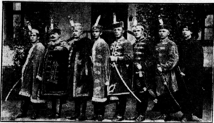
A püspökladányi Voge helyi csoportja nagy sikerrel adta elő a Bánk bánt. A darab szereplői.