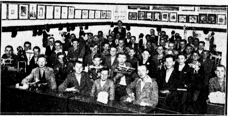
FENT: A kollégiumi polgári iskola I. b. osztálya. LENT: A kollégiumi polgári iskola IV. a. osztálya.