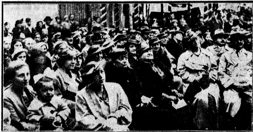
A Zita hadiárvaház kerti ünnepélyéről. Nagy közönség hallgatja a hadiárvák előadását.