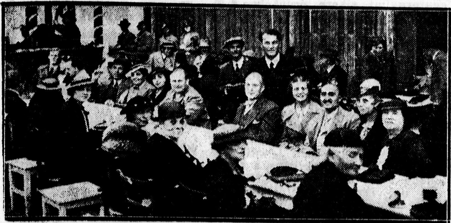
A kerti ünnepély közönségének egyrésze.