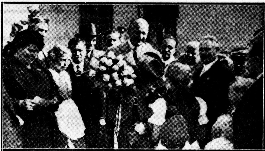
Az Irén uca 4. szám alatt a Nemzeti Egység pártjának új körhelyisége nyílt meg, melyet vasárnap avattak fel. — Képünk: báró Vay László főispán megérkezése a Kör felavatására. Egy magyarruhás kislány virágosokot nyújt át neki.