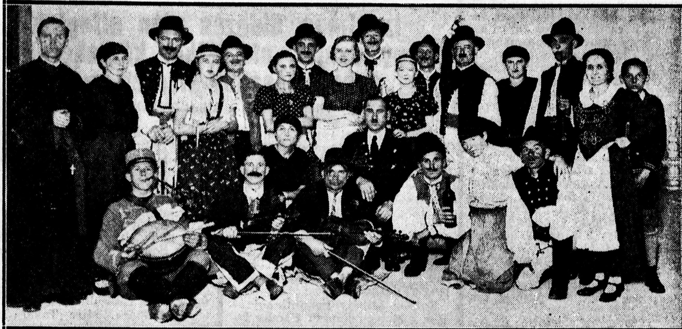
A „Gyimesi vadvirág”-ot sikerrel adták elő az egyetemi al tisztek műkedvelői.