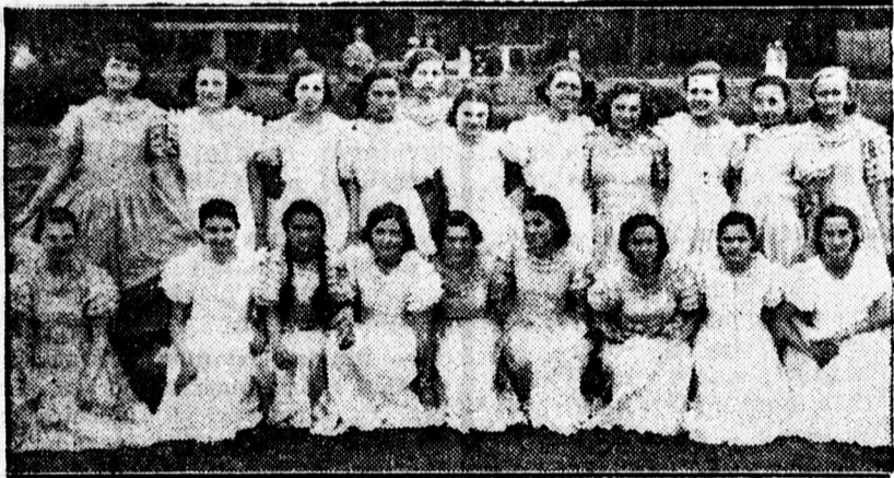
A Női Felsőkereskedelmi Iskola tornabemutatóján szereplő ritmikus táncot előadó növendékek csoportja.

Általában azzal a megnyugtató tudattal oszlott el a bemutató nagyszámú közönsége, hogy a legmodernebb testnevelési oktatás és munka folyik az iskola falai között az egészszeg, szépség, ép testben ép lélek gondolatának szem előtt tartásával.