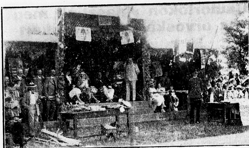
Járási levante-verseny Nagylétán. A közönség egy csoportja. Középen Szilágyi főispán.