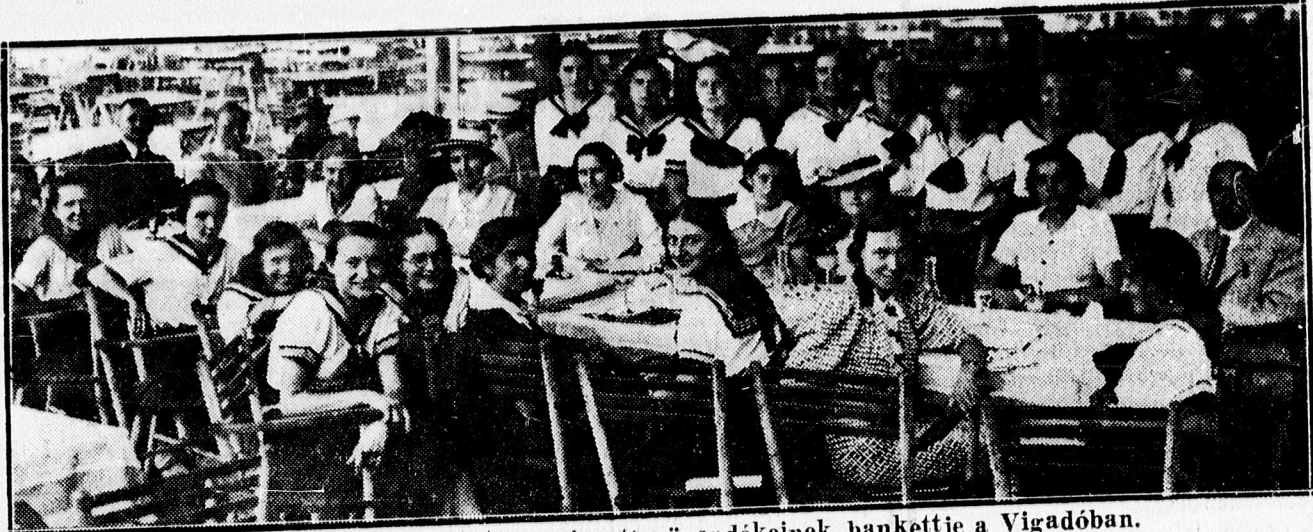
A Dócei tanítónőké pzóintézet végzett növendékeinek bankettje a Vigadóban.

— A Kálvinisták Templomegyesülete július hó 2-án, esütörtökön este 7 órai kezdettel jótékonycélu vacsorát rendez a nagyerdei Vigadóban, kedvezőtlen idő esetén az Arany Bika üvegtermében. Jegyvet a központi lelkészi hivatalban Siposs Imre titkárnál és este a pénztárnál is lehet váltani. — Kérjük azokat az urasszonyokat, kiknél jegyek vannak, hogy 1-én, szerdán délig okvetlenül jelentsék, hány személyre óhajtanak vacsorát, hogy az biztosítottassék részükre. A leányokat kérjük, egyszerű nyári ruhában jelenjenek meg, a „Karádi lakodalomban” szereplők pedig karádi öltözetben fájjenek. A Templomegyesület vezetősége.