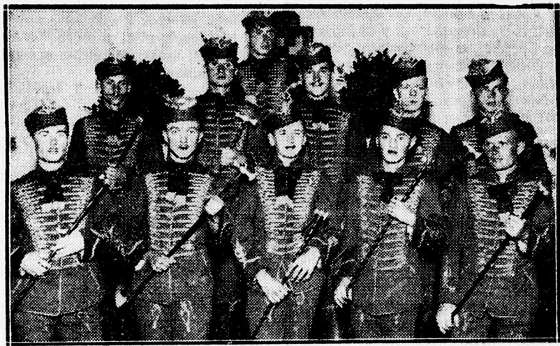
A hajdutánc szereplői.