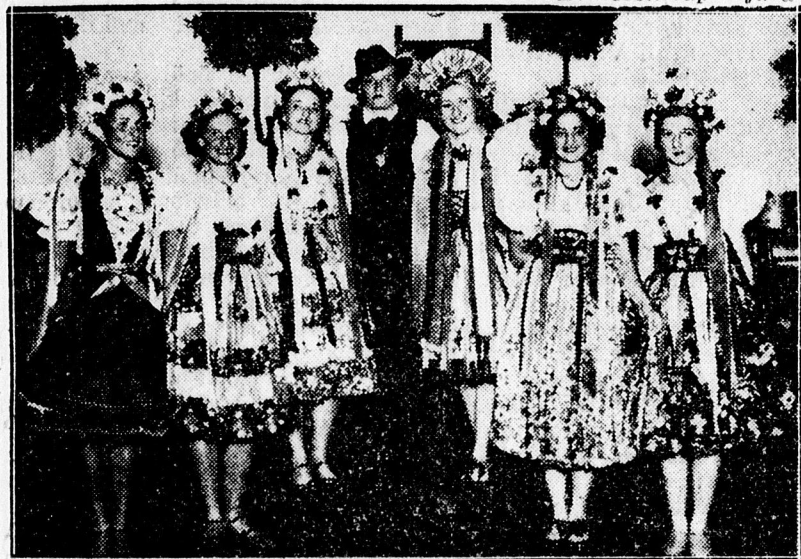
A legnagyobb sikert aratott Magyar rapszódia szereplői.