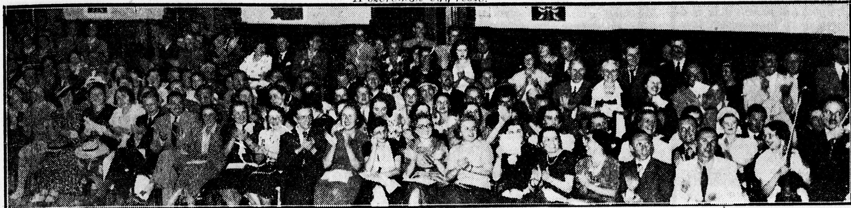
Lelkesen tapsolja a közönség a táncszámokat.