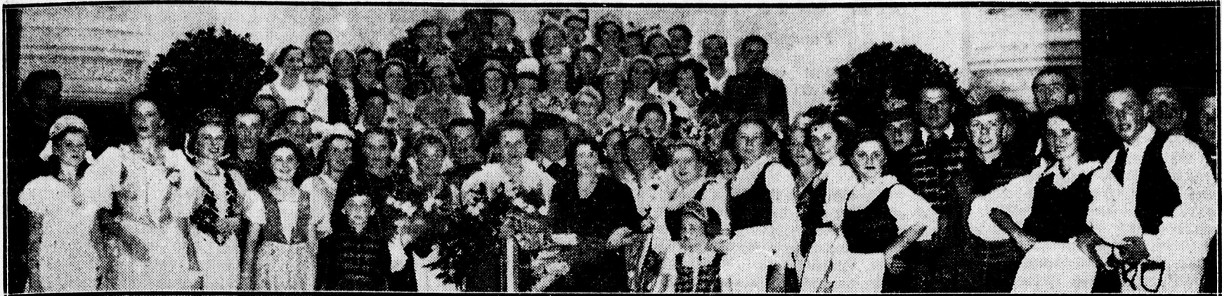
A szerenlők egy része.