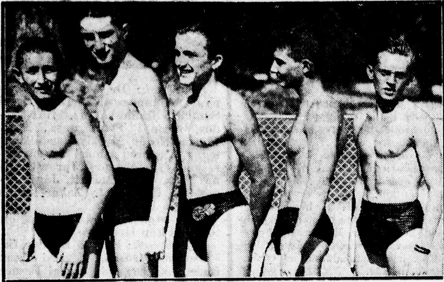
A ref. gimnázium vízpolócsapata.