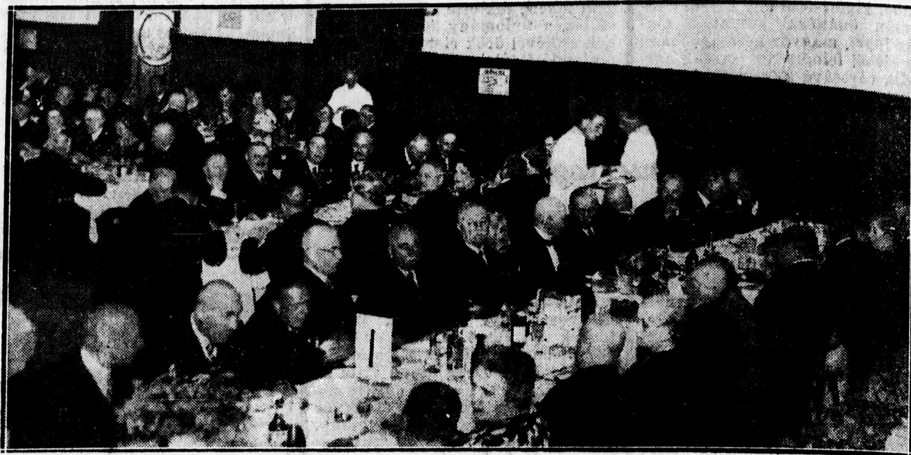
A birókongresszus ismerkedési estélyéről.

A Református Tanítók Vegyeskara I. hó 25-én, pénteken délután 5 órakor a próbatérben — Fűvészkert u. 2. — közgyűlést tart. Tárgysorozat: jelentés a múlt évről, a pénztárvizsgálásról és tisztújítás. A működő és pártoló tagokat ezután hívja meg az elnökség.