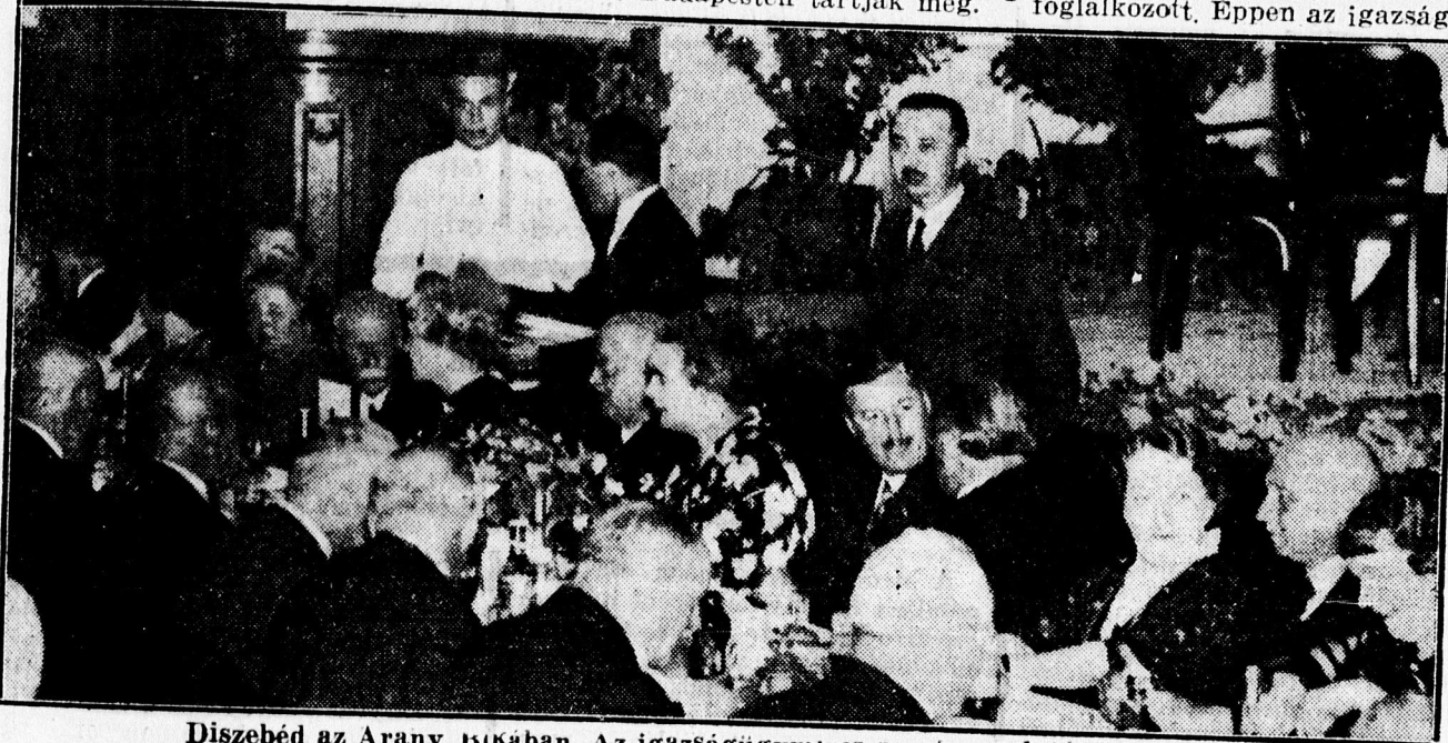
Diszbed az Arany Bikában. Az igazságügyminiszter és az elnökség asztala.

Ezután a közgyűlés megállapította abban, hogy a jövő évi kongresszust Budapesten tartják meg.