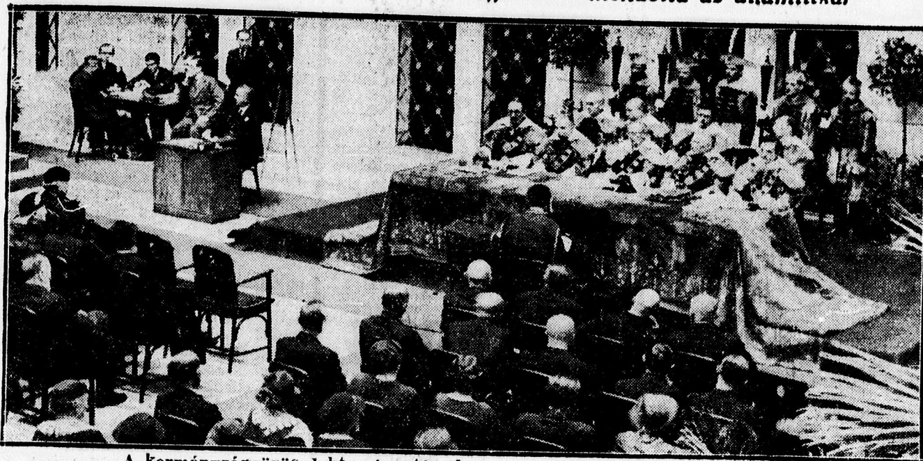
A kormányzógyűrűs doktorráavatásról. Az egyetemi tanács teljes díszben.

„Magyar ifju ne csüggedj! Fel a fejjel!” — mondotta az államtitkár