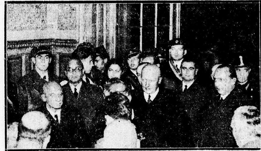
Szily államtitkár fogadtatása a pályaudvaron.

— Istentisztelet az unitárius templomban. Debrecen, Hatvan uca 24. szám alatt levő unitárius templomban f. évi november hó 1-én, vasárnap délelőtt 10 órai kezdettel rendes vasárnapi istentiszteletet tartanak. Ez alkalommal imádkozik, prédikál: Józán Miklós püspöki vikárius. Istentisztelet után rendes őszi közgyűlés lesz.