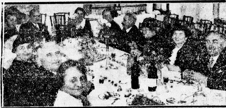
Az I. sz. gazdasági iskola háztartási tanfolyamáról.