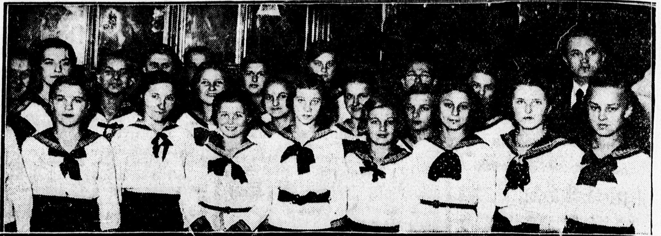
A reformációi emlékünnepegy szereplői.

ELŐFIZETÉSI ÁRA 6 ingyen „Kincses-tár”-kötettel évi 9 pengő 60 fillér