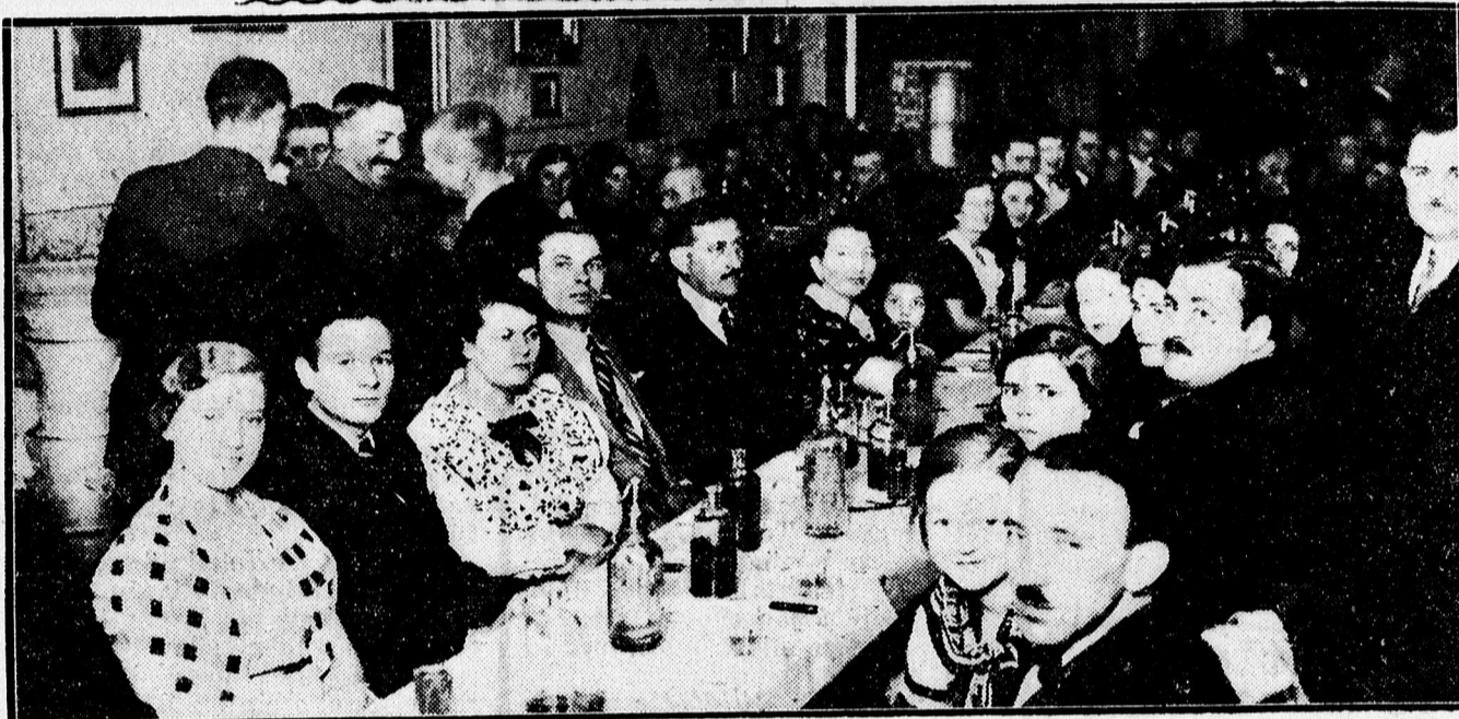
Társasvacsora a homokerti Olvasókörben.