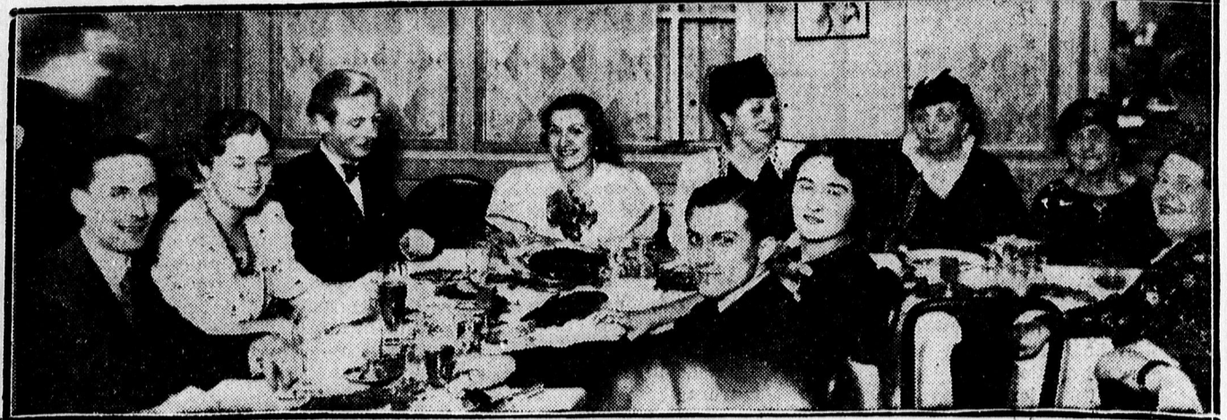
A Vasutas Mansz estélyéről.

A gazdák azt is kérték, hogy a juhok téli legeltetési időpontját se határozzák meg. Ezt a kérést a polgármester már nem tudja teljesíteni, mert feltétlenül tudnia kell a számvetésnek, hogy mikor kezdődik a téli juhlegeltetés.