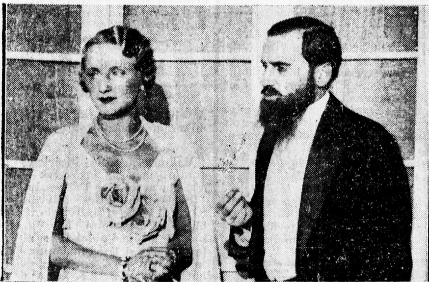
Somlay és Alszegehy „A nők barátja” c. vígjátékban.

Időprognózis: Észak szél, ma különösen a szélső nyugati és keleti megyékben lesz élénk. Egyes helyeken kisebb esők, a magasabb fekvésű helyeken kisebb havazás, a hőmérséklet esőkken.