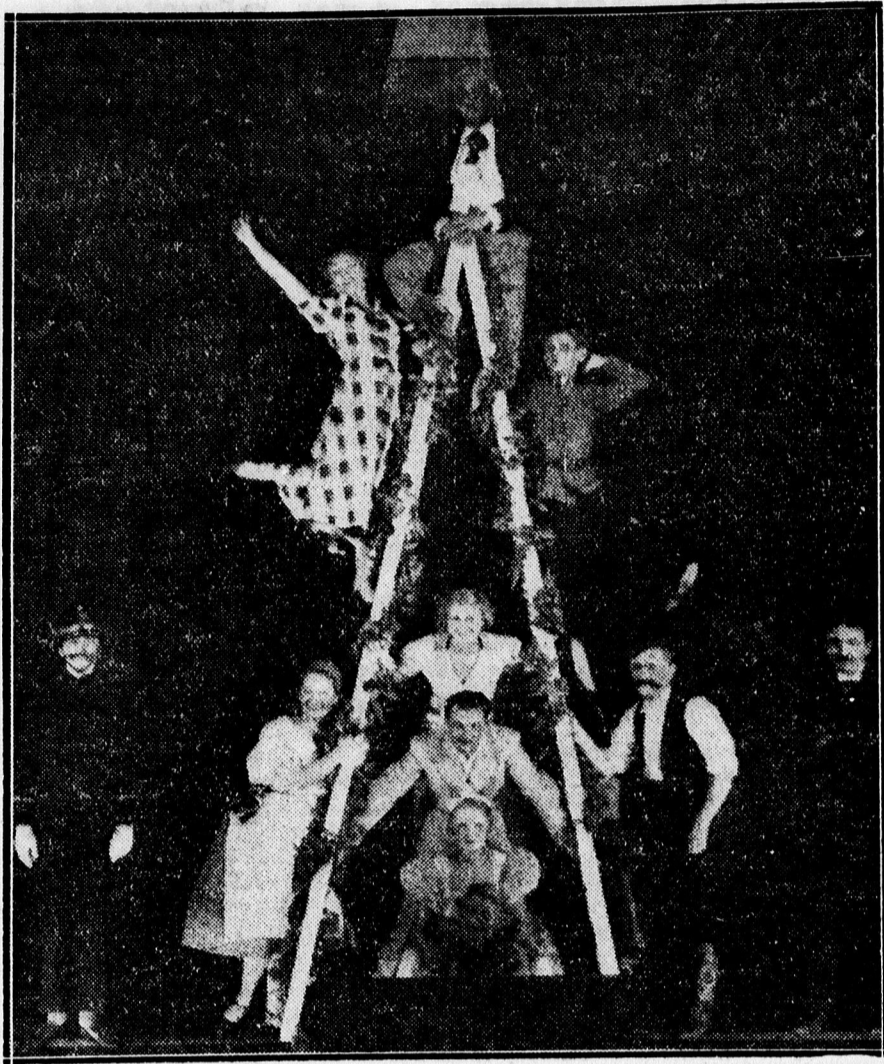
Jelenet a „Csavargólány c. operett harmadik felvonásából.