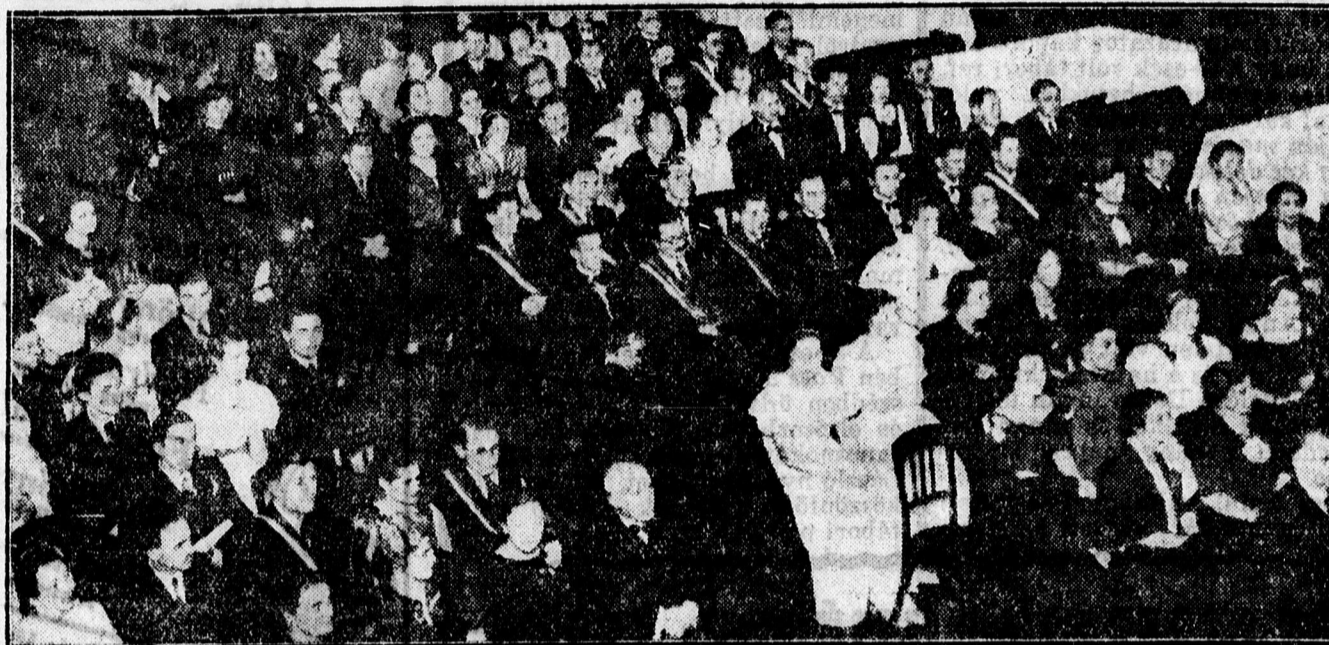
A Werbőczy B. E. Horthy törzsének díszlátogatásáról

FEUER DIVATHÁZ, Csapó uca 26. karácsonyi ajánlata