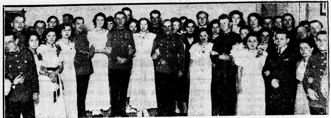
Tűzérallisztek Miklós-napi táncestélyéről.