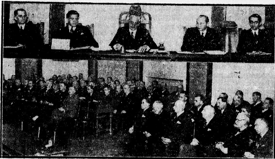
Az orvoskamara közgyűléséről. Fent az elnökség, lent a közgyűlés tagjai.

Beszéde végén érdekes tapasztalatairól tett említést, melyeket Németországban szerzett, ahol a lakosság 95 százaléka biztosított pénztári tag és a pénztári orvos jö-