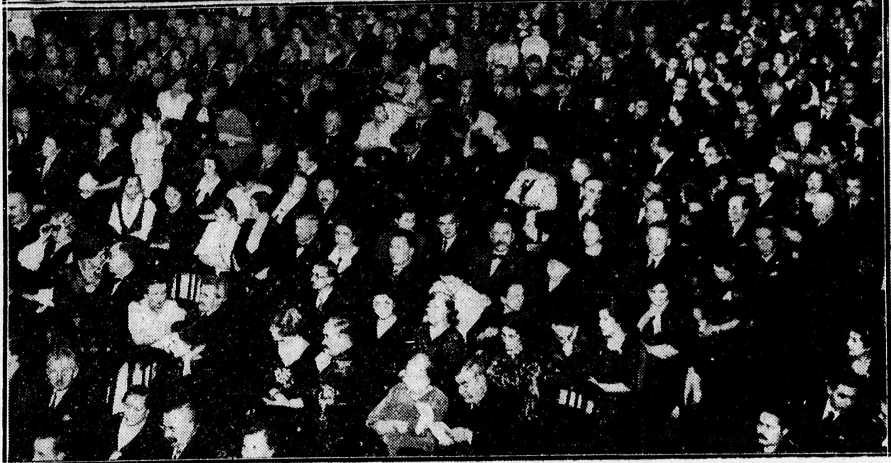
Szenci Molnár ének- és zenekar hangversenyének közönsége az Arany Bika dísztermében. — Fent az ének- és zenekar.