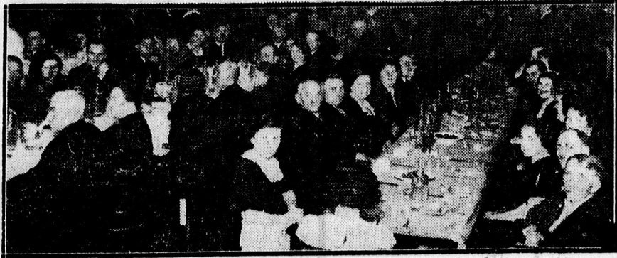
A nyugdíjba vonult Máv. műhelyi alkalmazottak tiszteletére rendezett vacsoráról.