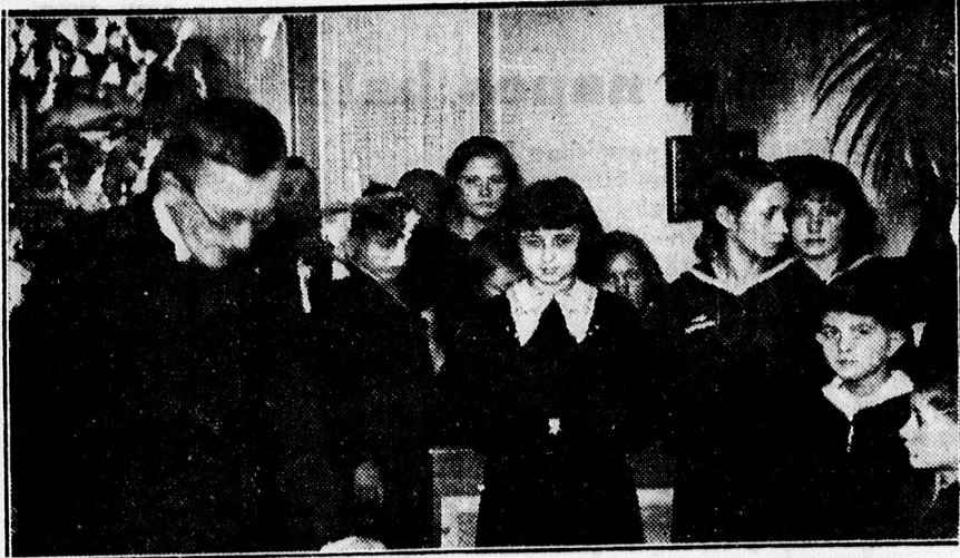
A Legányi Schaffer alapítvány karácsonyi ünnepélye.

MERCEDES, TRIUMPH, RHEINMETALL KÉPVISELET, IPARK AMARA PALOTA, Telefon: 17-93.