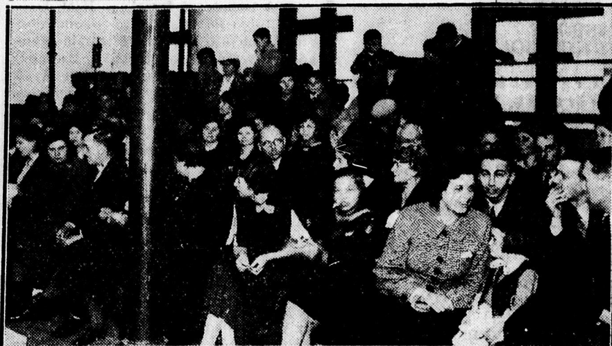
A dohánygyári munkások karácsonyfaünnepélyéről. Fent a szereplők, lent az ünnepély közönsége.