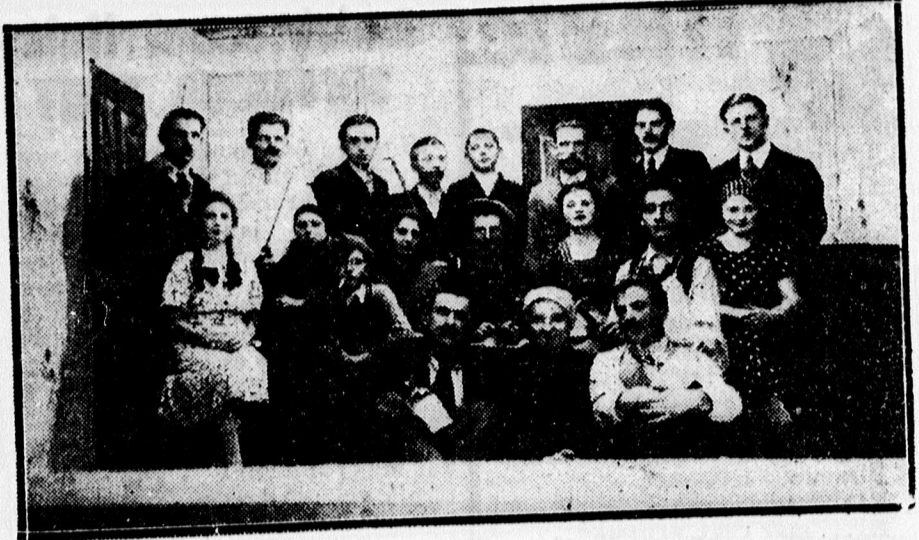
A berettyóújfalui iparosok és kereskedők körében nagy sikerrel adták elő a „Károlykának eszma kék” című mulatságos szindarabot. Képünk a szindarab szereplőit ábrázolja.