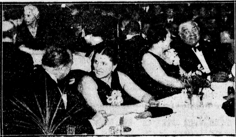
Előkelőségek a ref. gimnázium Csokonai teáján az Arany Bika dísztermében.

— Az Országos Ügyvédszövetség debreceni osztálya, január hó 19 napján, kedden este hat órakor az Arany Bika földszinti olvasótermében tartja rendes heti összejövetelét, melyre a kartársakat ezúton hívja meg az elnökség.