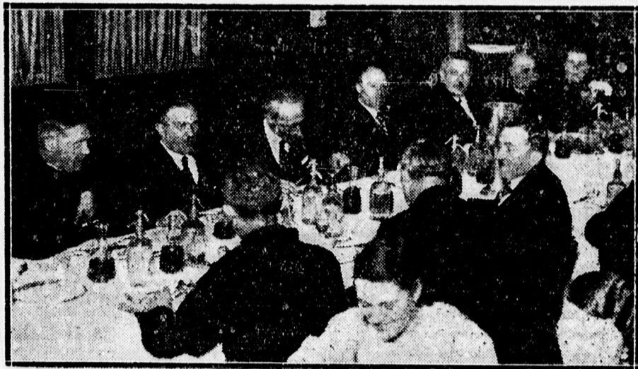
A Máv. Horthy Dalegylet serlegavató vacsorájáról.