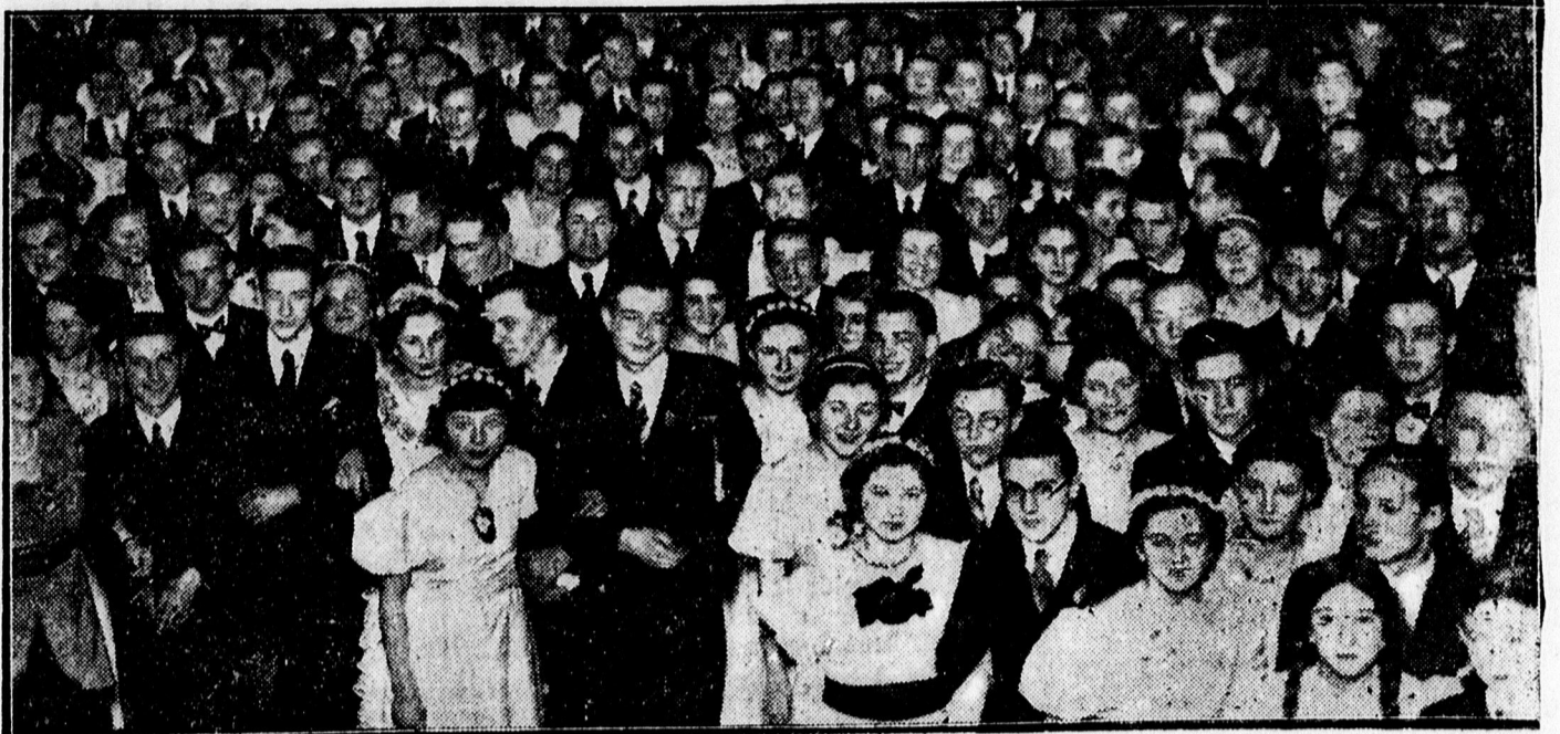
A ref. főgimnázium Csokonai teája az Arany Bika dísztermében. — A táncoló ifjuság.

3 levelező lap, 3 különböző felvételtől 1.96 P. Berzseki műtermében, Piac uca 38. szám,