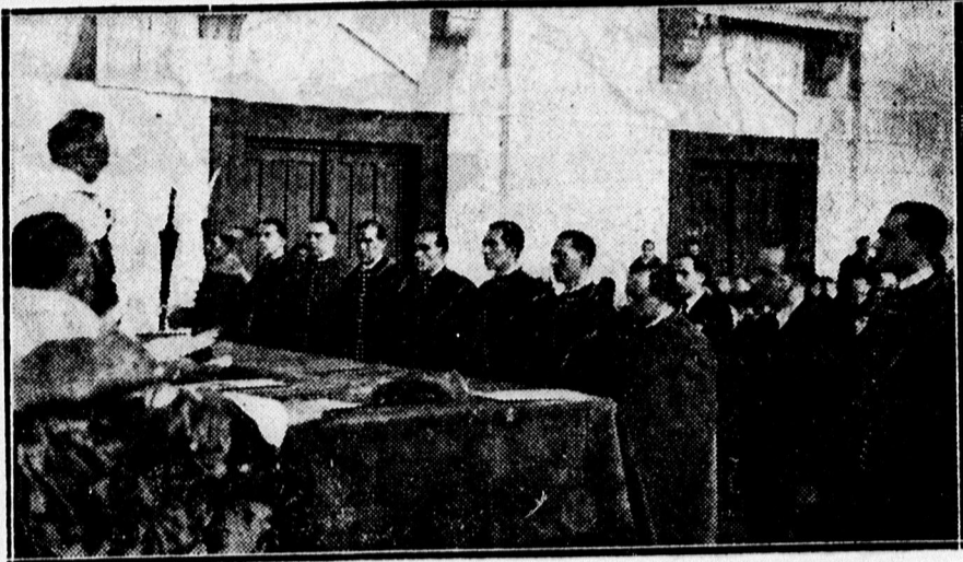
Doktoravatás az egyetemen.

Erés tempóban folynak a próbák a Csokonai-színház következő bemutatására. A prózai együttes Bókay János: MEGVÉDTEM EGY ASSZONYT című vígjátékára készül, az operettegyüttes pedig egy szenzációs, kiállításos revüdarab próbásorozatát kezdte el.