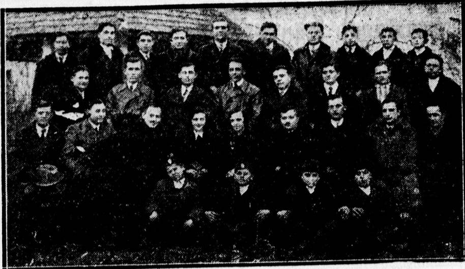
A KOMÁDI KIE MŰSOROS ESTJÉNEK SZEREPLŐI.