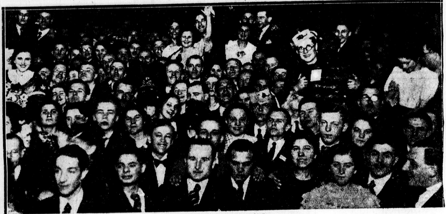
A SZÁROK DA-JARÓ.