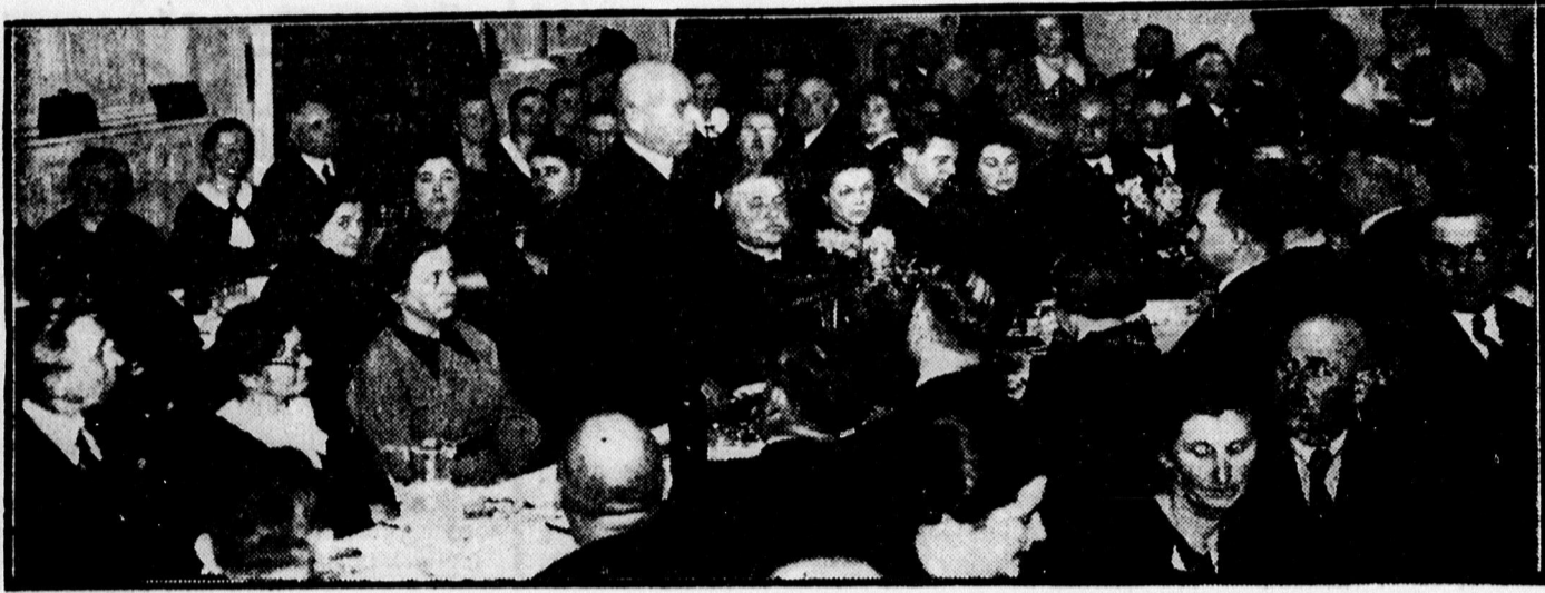
Maklár püspök beszél az árpádtéri egyházzész bucsúvacsoráján.