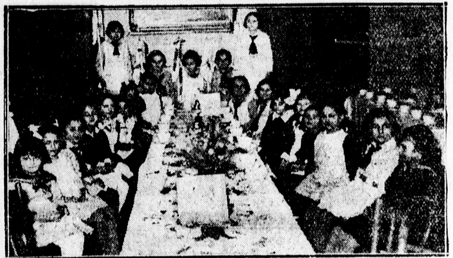
Evangélikusok eserkészcsapatának teadélutánjáról.

— Hatalmas fagyot jelent az ország kereskedelme számára a január—fe- bruár hónap: a vevők már fedezték teli szükségeit, de a tavaszi beruházá- soktól még hónapok választják el a vá- sárló közönséget. Az élelmes kereskedő azonban ebben a fagyos esőndben is segít magán: ügyes reklámmal hirdalja át a holtaszont. A sikeres reklámbor rengeteg ötletet nyer a „Reklámélet”- ből, az egyetlen magyar reklámszak- lapból, amelynek új száma most jelen- meg. Szerkesztő: Balogh Sándor. — Kiadóhivatal: Budapest, V., Lipót- körút 9. sz. — Kemoly érdeklődőknek készséggel küld mutatványzatot a ki- adóhivatal.