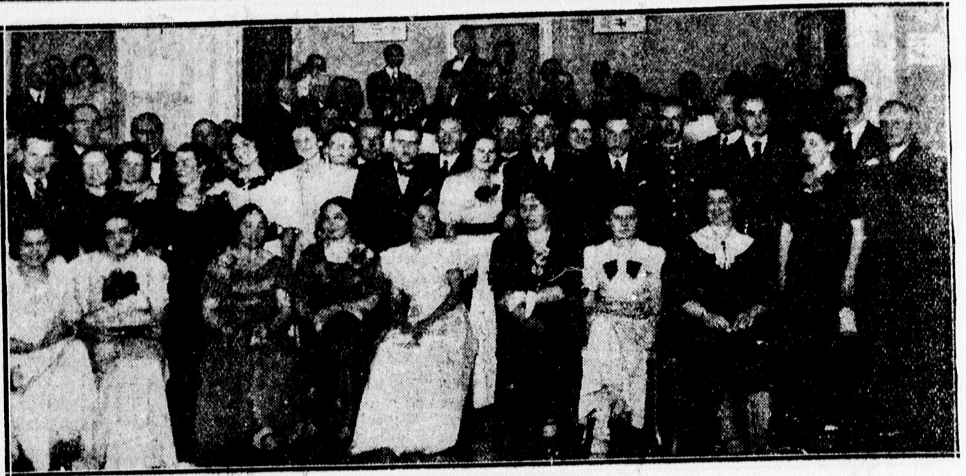
A Turista-bál közönsége.

— A Tenitár Szabadegyeteme előadássorozatában február 3-án, szerdán délután 5 órakor dr Ru- gonfalvi Kiss István egyetemi ny- r. tanár lesz az előadó, ki: „A vi- lágnézetek harca” címen megkez- dett előadását folytatja. Ez lesz az előadássorozat befejezése. Hat óra- kor a felmerült kérdésekre fog válaszolni az előadó. A kérdések — olvasható irással — cédulára iran- dók. Név nélkül bedobandók a ki- tett levelesládába. Az előadás a Kollégium fűtött dísztermében lesz. Érdeklődőket szívesen lát s pontos megjelenést kér a rendező- ség.