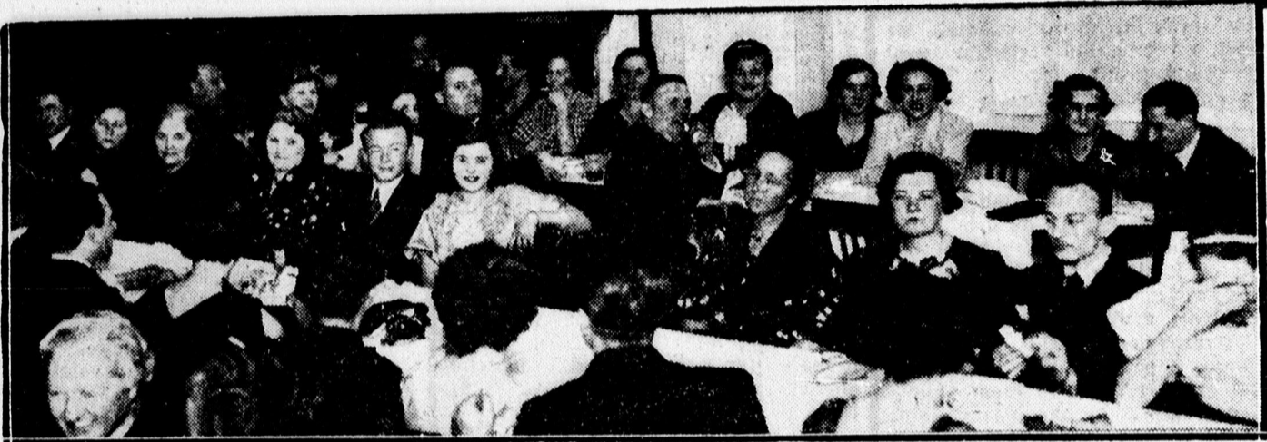
Mansz tearól az Arany Bikában.