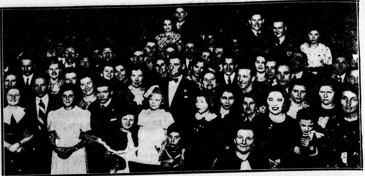
Dohánygyári Dalegylet báljáról a Koro nában.

Köszönetnyilvánítás. Is'enben meg- boldogult felejtethetetlen jó édesapánk,