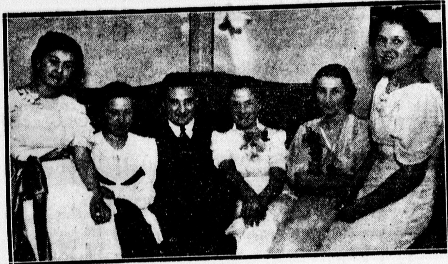
Boldog Margit Leányklub előadásának szereplői a Vitézi székházban