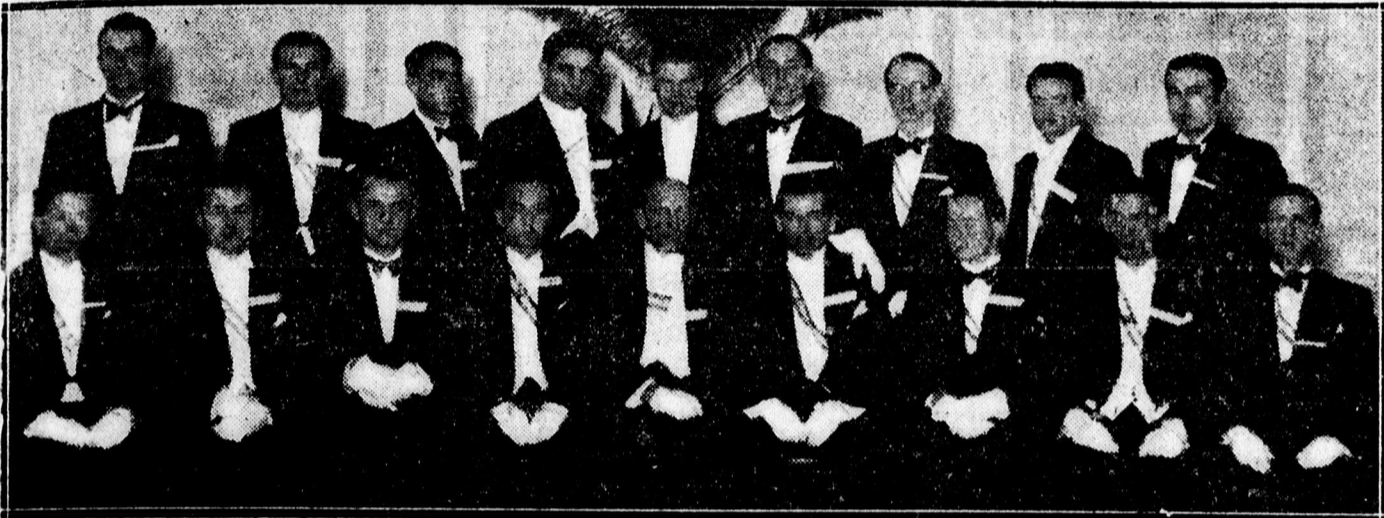
Fent: Első bálózók a Csaba bálon az Arany Bika dísztermében. Lent: A Csaba bál rendezői az Arany Bika dísztermében.