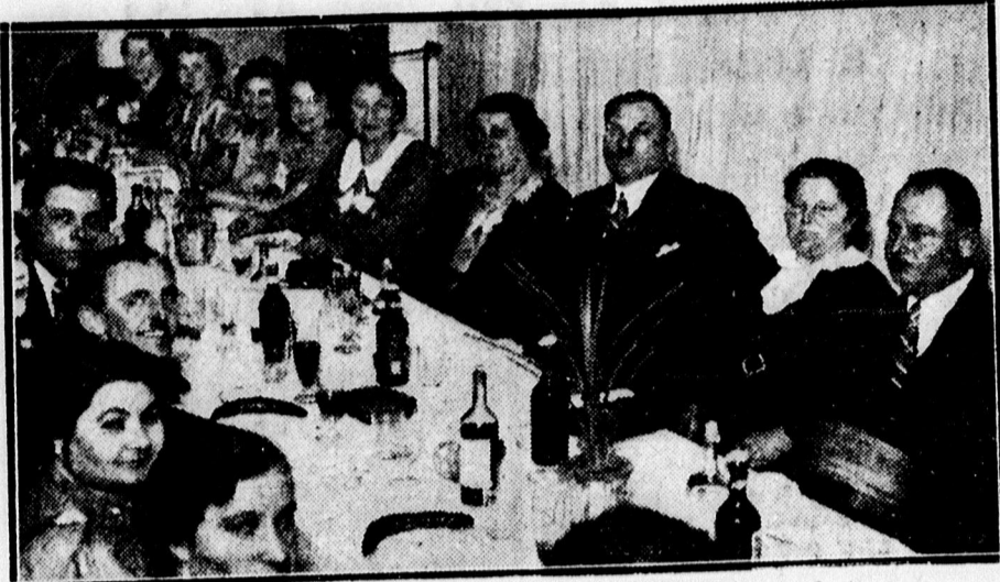
A nyugalmabavonult főmozdonyvezetők búcsúvacsorájáról az Arany Bika Bocs Kay termében.