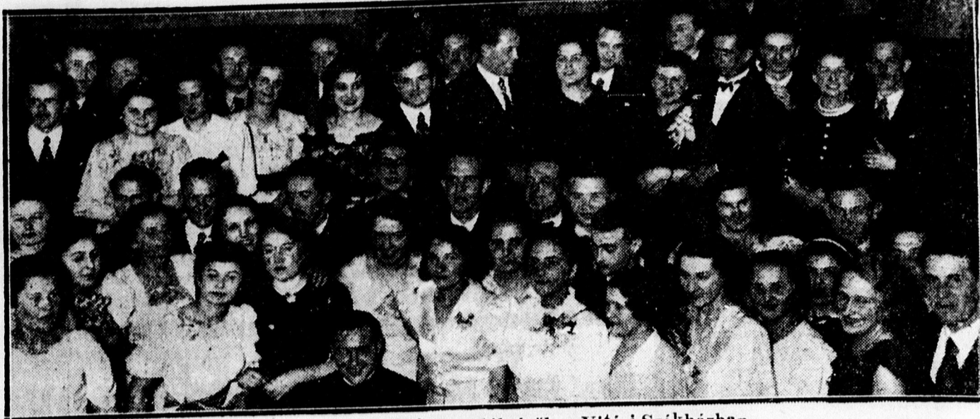
Boldog Margit Leányklub estélyéről a Vitézi Székházban.

— A nyomozás titkaját leplezi le rendkívül érdekes képekkel illusztrált cikkben a Tolnai Világlapja új száma. Egy szám ára 20 fillér.