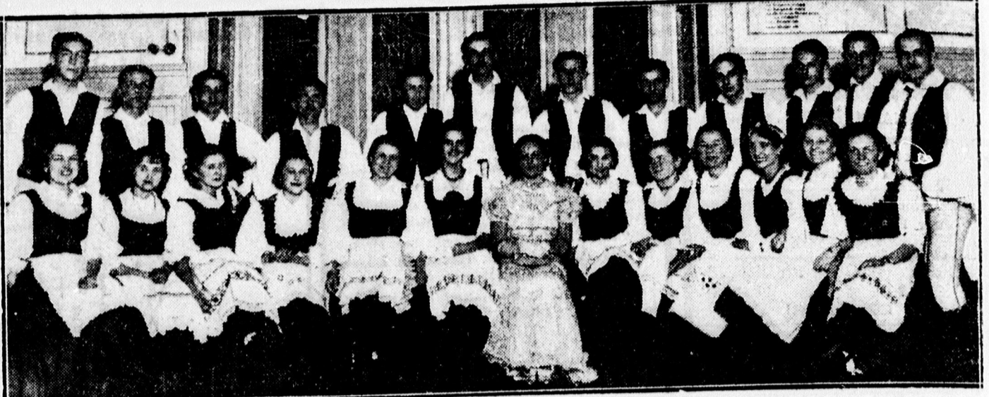
A „Kopogós” résztvevői a Szeffe-bálon.