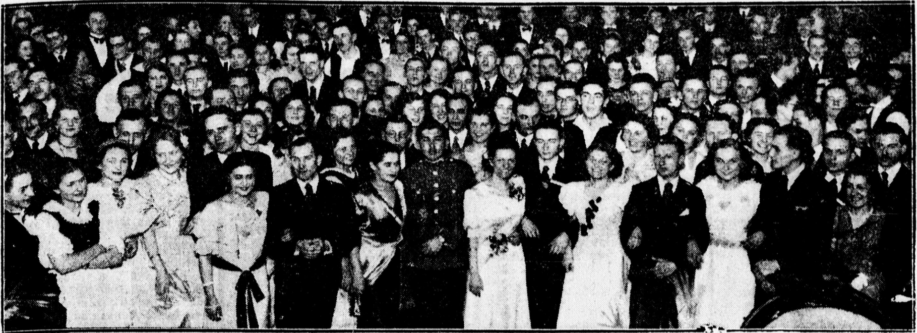
Táncoló ifjúság a Szeffe-bálon az Arany Bika disztermében.