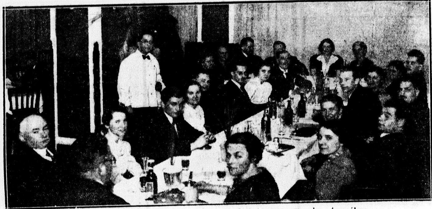
Az Unitárius-estet követő társasvacsoráról az Arany Bika Boesky termében.