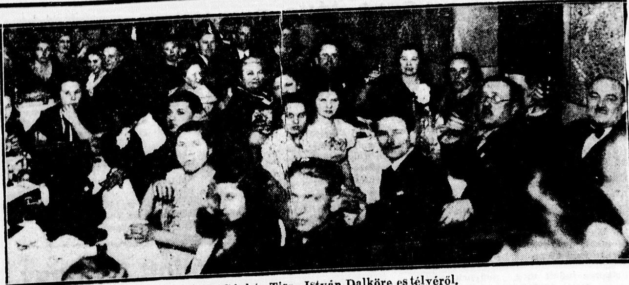
Egyetemi Gépház Tisza István Dalköre es telyéről.

x Fényképezögép 2 pengötöl, jó gramofon 10 pengötöl, villanykörte csere 20 fillér. Mindent cserélünk. Vagyonmenö, Hunyadi ucca 18. sz.