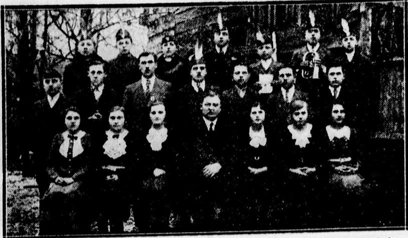
A kabal levante ifjak évnvítő műkedvelő előadásának szereplői. — Rendező Dede Kálmán főoktató (x).