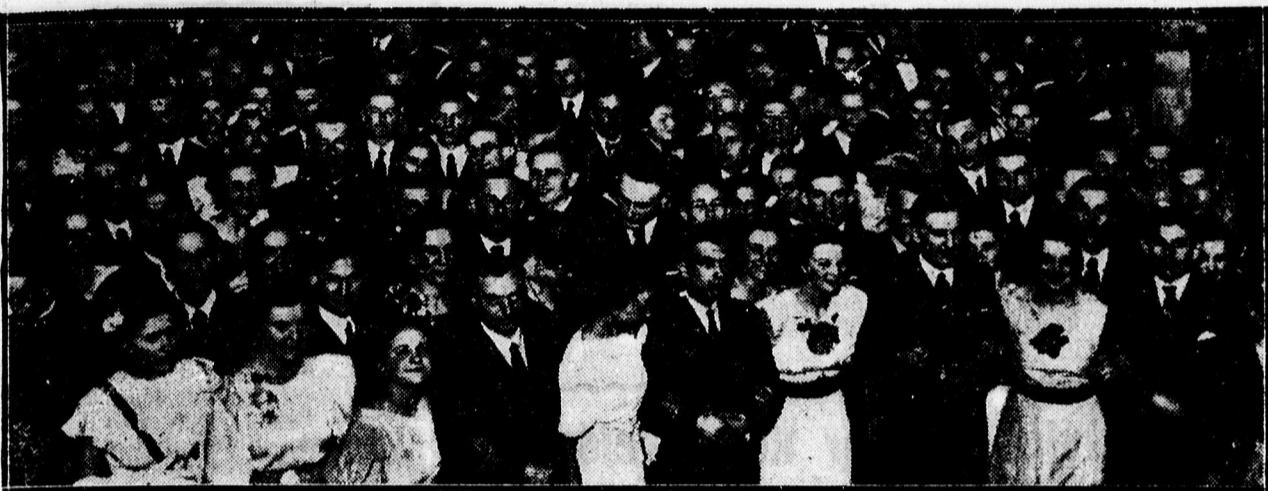
Táncoló ifjúság a református asszonyok teaestjén az Arany Bika dísztermében.