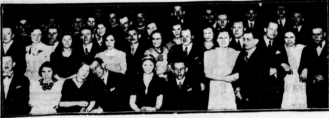
Az Iparos Dalkör teaeztélyéről.