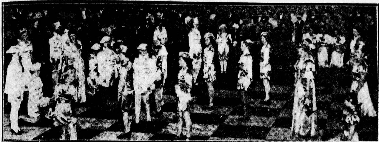
Előszakk szereplői a református asszonyok nagyszerű teastjén az Arany Bika dísztermében.