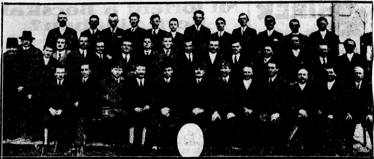
A nádudvari wazdatanfolyam hallgatói és az előadók.