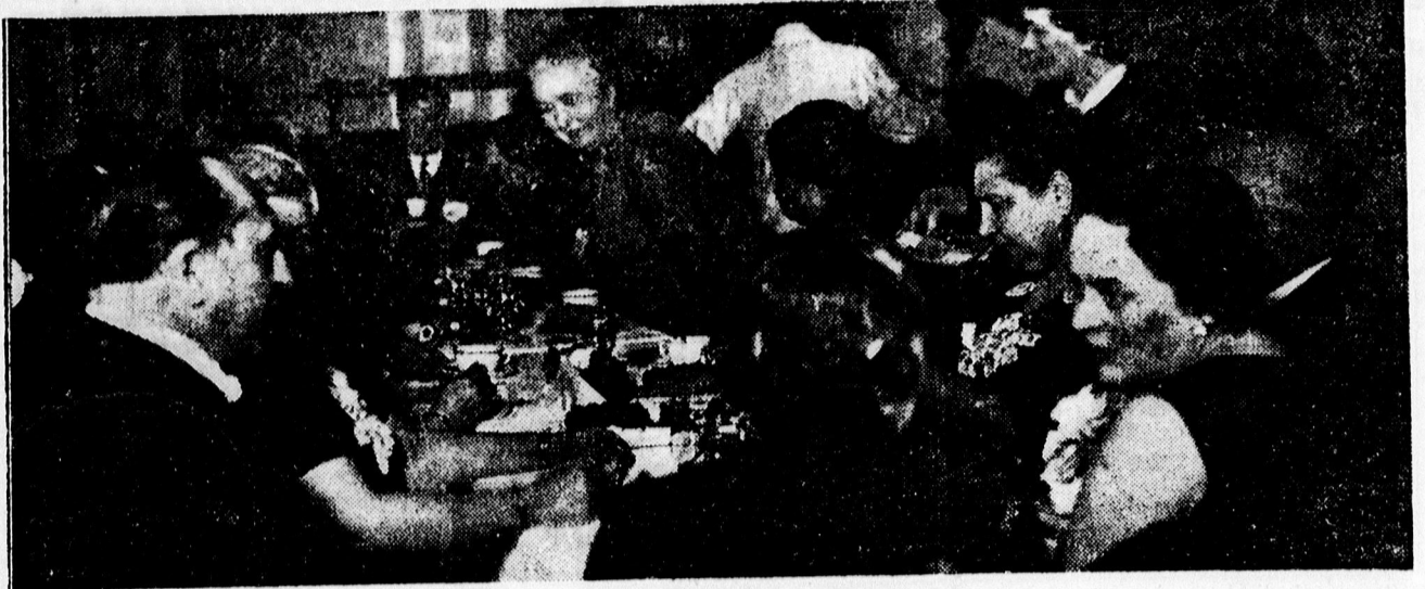
Előkelőségek az Arany Bikában, a Lilla-teán.

A debreceni Nemzeti Egység Párt lauk pincér főcsoportja az Újságíró Club összes helyiségeiben Ferenc József út (Piac uca) 26. szám. Gambrius passage március 18-án este 10 órai kezdettel táncos egybekötött jótékony célú zárkörű családi összejövetelt rendez az elagott pincérek felszelyezésére.