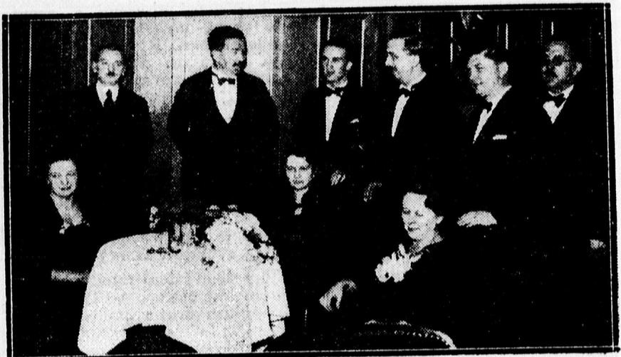
A vendéglősből bálanyái és rendezősége.

— Két év alatt hét gyermeke született. Königsbergből jelentik: Egy litván parasztasszony a napokban négyes ikrekre kadott életet, két fiúnak és két leánynak. Az esetet még érdekesebbé teszi az, hogy ugyanaz a parasztasszony két évvel ezelőtt hármas ikreknek adott életet.