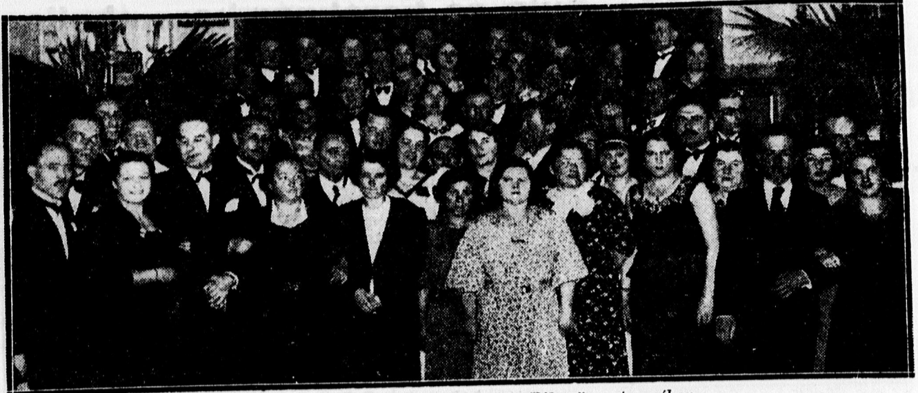
A vendéglősből az Arany Bika üvegtermében.

— A tenyészállatvásáron a magyar juhászatoknak nagy sikere lesz. A legnemesebb szöve'ek készülnek a magyar juhaink gyapjújából. A magyar úri családok posztógyára Önnek is közzelmenül küldi szövetmintáit, minden költségtelenség és költség nélkül. Levélzólapon még ma kérje Trunkhahn Posztógyár, Budapest, XI. Lenke út 117. szám.