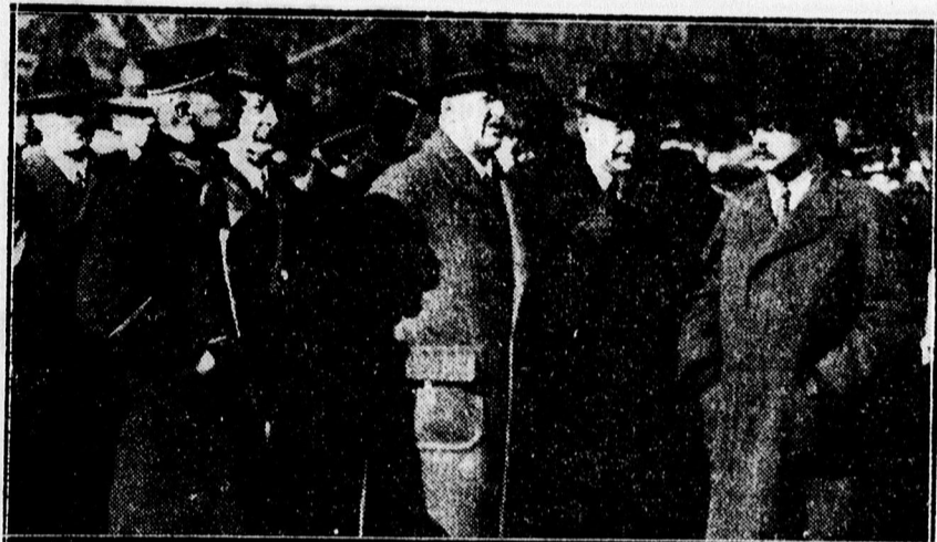
Lázár igazságügyminiszter, Fáy főispán és Kölesey polgármester az ünnepélyen.

A Magyar Jövő Szövetség, a Turul, a hadirokkantak és végül nyilaskeresztesek nemzeti színű koszorúja került a