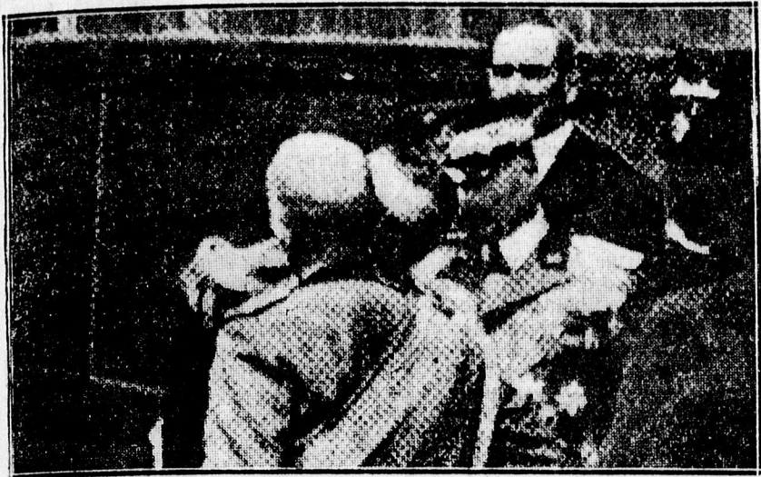
Horthy kormányzó átöleli Olaszország királyát és a két államfő megcsókolja egymást.