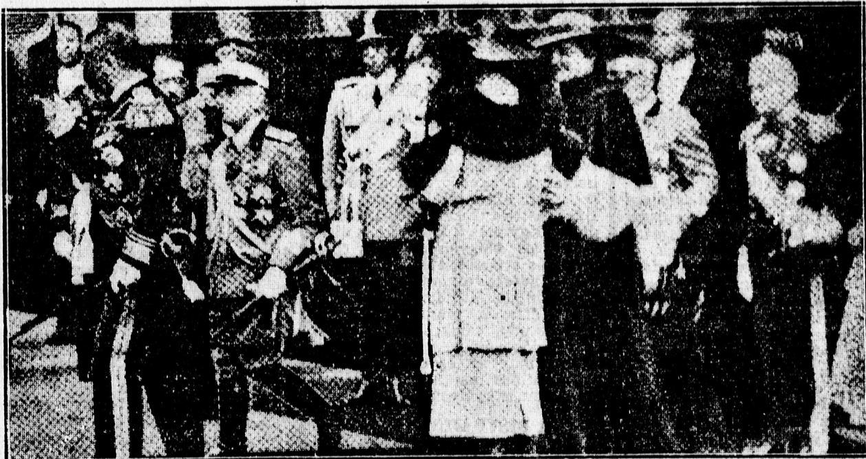
Horthy kormányzó Viktor Emánuel olasz királlyal a megerkezés után. Jobboldalt Elena királyné Horthy kormányzó feleségével.

minden. A pompás délszaki nővérek között fejjel a magasból rejtett, élesfényű reflektorok szórják fényüket a gyönyörűen feldíszített várócsarnokra. Mindenütt palma, babér, borostyán. A főbejáratnál kétoldalt hatalmas hófehér oszlopok álljonva nemzetiszínű lobogókkal és nővérekkel díszítve.