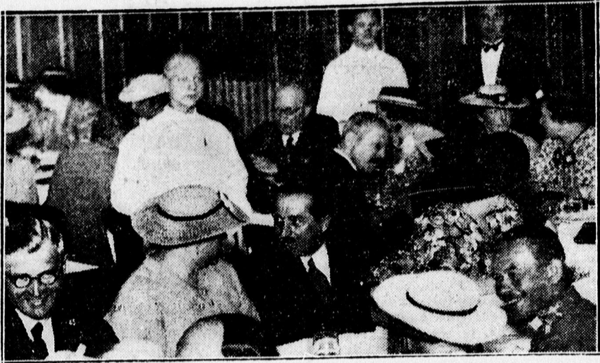
A Mansz fagyalttestjéről az Arany Bikában.

— A temető haláleset miatt zárva. Az egyik bácskai községben a temetőt látogató közönség legnagyobb esodálkozására tegnapelőtt zárva volt a temetőkapu. Hiába zörögtek, nem jött elő senki, hogy a kaput kinyissa. A bezárt kapun egy cédula lógott következő felirattal: A temető haláleset miatt zárva. Kiderült, hogy a községi temető öréneke édesapja a szomszéd faluban meghalt. A temetőörnek el kellett utaznia a temetésre, távollétére helyettesről gondoskodni nem tudott, így hát egyszerűen bezárta a gondjaita bíró temető kapuját.