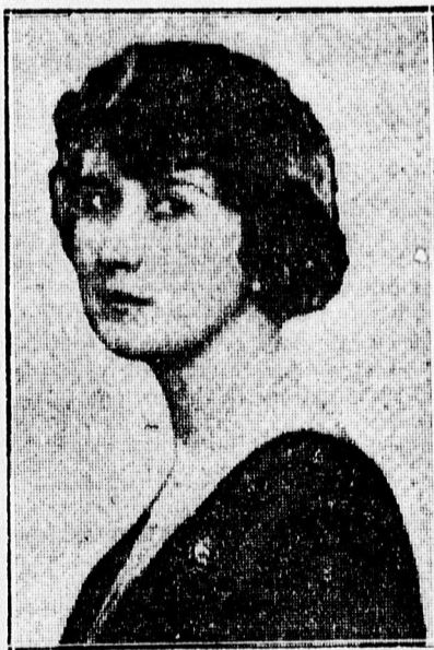
Albrecht főherceg elvált felesége.

hogy közös megegyezéssel akarják a házasságot felbontani — lehetőleg minél kisebb nyilvánosság előtt.