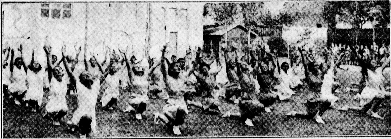
A Dóczy tanítónőképző intézet ritmikus gyakorlatokat mutat be a ref. gimnázium tornaünnepélyén.