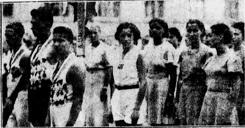
Felvonulás a ref. gimnázium díszes tornaünnepélyén. A Dóczy tanítónőképző táncos csoportja.

Prága, június 2. Dr. Tuka Béla egykori töt autonomista képviselőt nyolc évi raboskodás után szabadlábra helyezték. Tukát nyolcezer forinttal és öt évvel csökkentették az életfogytig tartó büntetését. Az igazságügyminiszter Tukát további intézkedésig rendőri felügyelet alá helyezte.