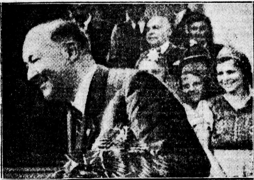
Darányi miniszterelnök a balatonfüredi fogadtatáson.

Brüsszel, jun. 7. Belga Tl. Azok a külföldön elterjedt hírek, hogy Vilmos volt német császár halálán van, alaptalanok. A volt császár kitűnő egészségnek örvend és mindennap sétát tesz kastély kertjében.