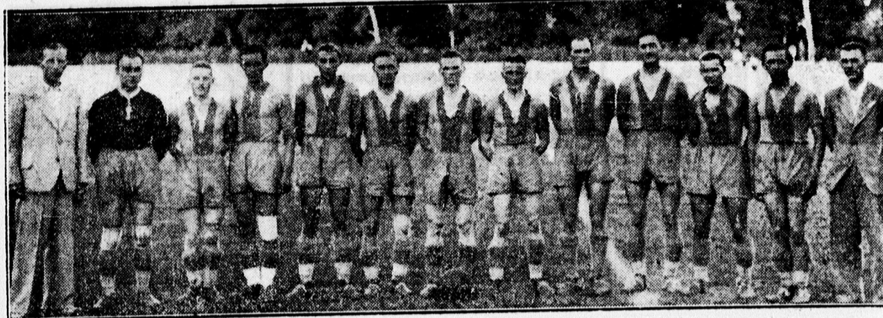
Fent: A Női Felső Kereskedelmi Iskola tornavizsgájáról. Lent: Keletmagyarország idei bajnokcsapata Villanygyár.