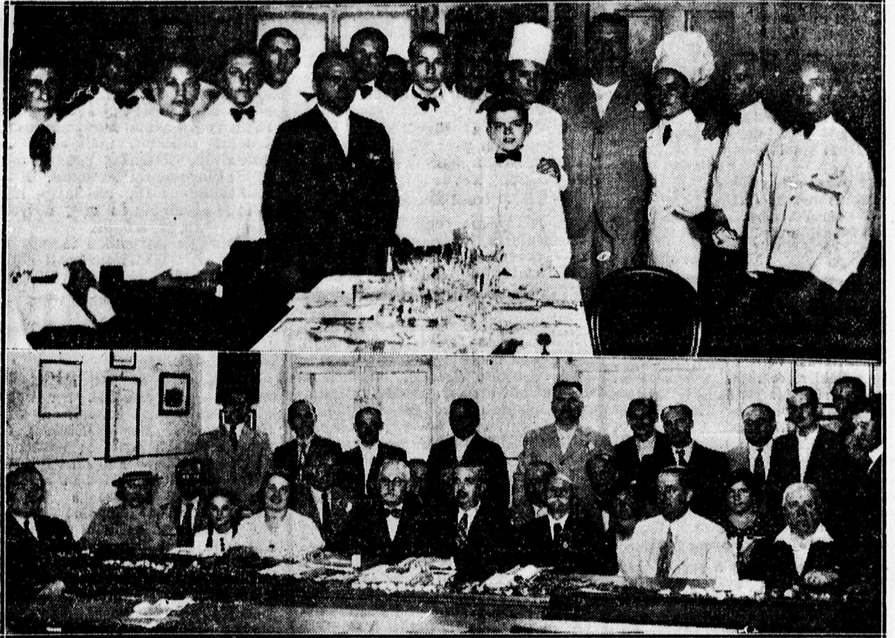
A pincérszakiskola vizsgájáról. A vizsgáztató bizottság és a szakiskola növendékei a vizsgán