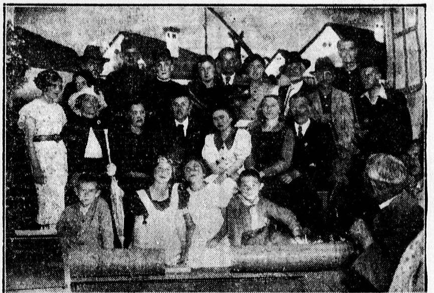
„Süt a nap” 3. fely. szindarab főpróbájáról. A Böszörményi uti polgári olvasóköri műkedvelő gárdája.

— Fényképsorozat a nyomorról. Miskolc város szociális bizottsága szerdai értekezletén Segesváry Viktor dr. gazdasági tanácsnok részletes jelentést tett a miskolci nyomorról. Beszámolójából íjlesztő kép tárult fel arról, hogy a nyomorba jutottak tabarakkokban, vizes, penészes lakásokban, a