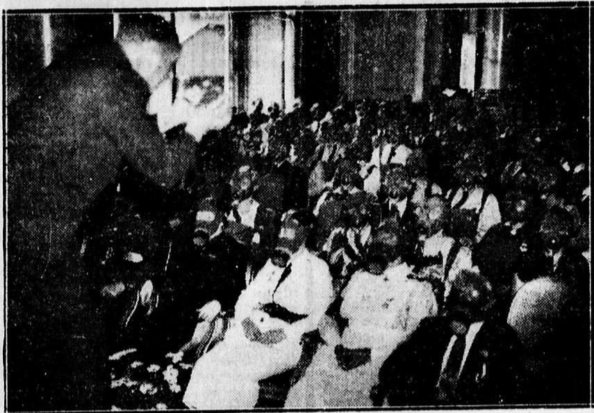
Géztudományi oktatás Londonban.