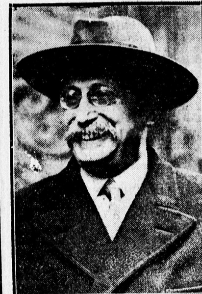
Leon Blum a lemondott francia miniszterelnök, ki az új kormányban miniszterelnökhelyettes lett.

Debreceni Helyi Vasút Részvénytársaság ügyeltigazgatósága. — 3596 937.