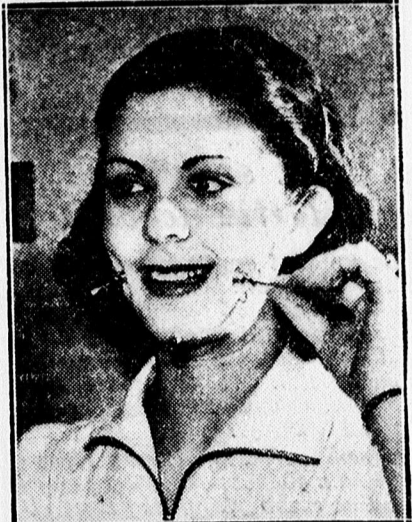
Mesterségesen is lehet arcködröcskéket csinálni. A képen látható fiatal hölgy erre a célra feltalált apparátussal