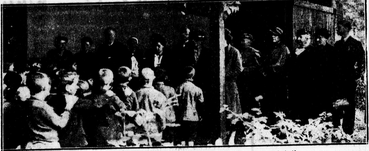
A MANSZ gyermeknyaralattási akciójának megnyitására.

x Tündérlaki szép a nagyerdei csónakozó fő este! Menjünk oda egy-egy órára evezni.