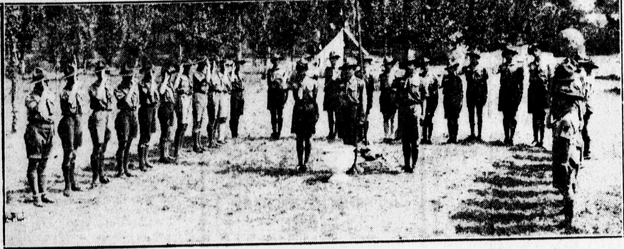
Ünnepélyes pillanat a zászló alatt.