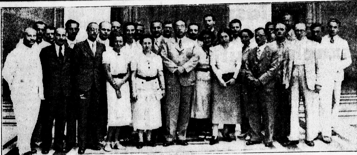
Olasz továbbképző tanfolyam hallgatói.