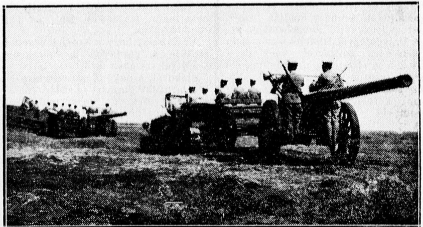
Japán ágyúk felvonulása a kínai fronton.

Beszélnék arról, hogy a japánok váratlanul általános rohamot akarnak indítani Peking ellen, hogy a város elfoglalásával kényszerítsék a kínai kormányt feltételeik elfogadására. A Reuter iroda is azt a jelentést adta ki, hogy a pekingi hatóságok a japánok készülődő rohamáról szereztek értesüléseket.