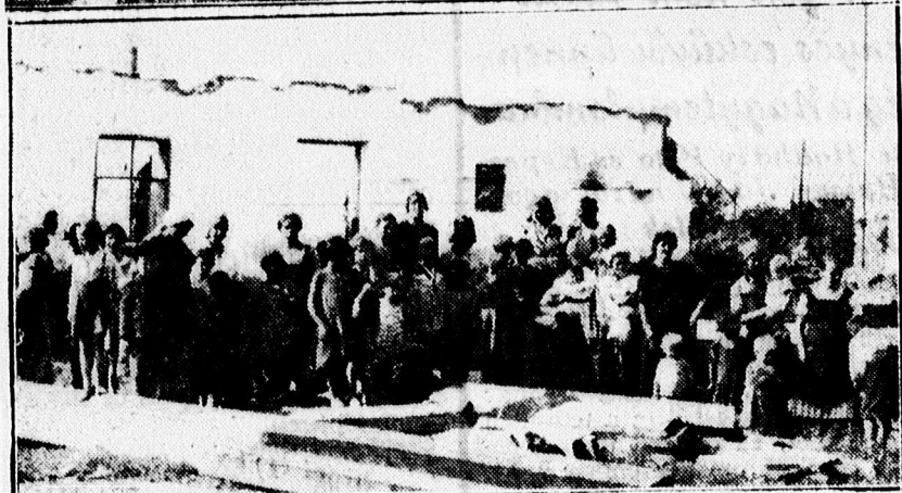
Fent: A lebontott Ghillányi laktanya. — Lent: A Ghillányi laktanya szerencsétlen lakói.

napsugaras délutánban is megdidergetti őket a bizonytalanság, a közelgő tél érzése, minék hajléktalanul néznek elébe.