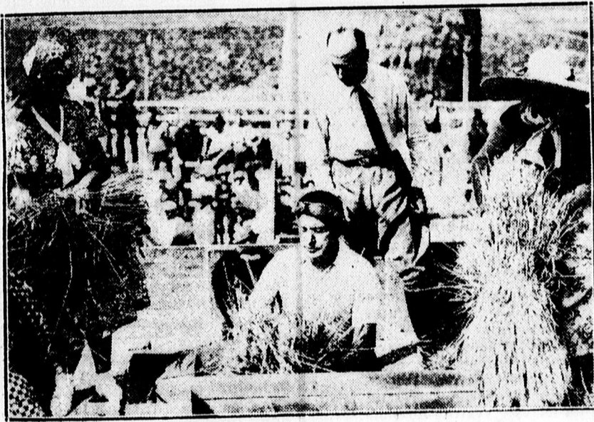
A Duce csépelei az első littorai gabonát.

A magyar-olasz kapcsolatoknak történelmi multja van, mely távoli évszázadokba nyúlik vissza. Ez a kapcsolat azonban az utolsó évtizedben olyan reneszánszát éli, amilyenre kevés példát találunk. A mostani kapcsolat nem egyszerű szimpátiához vezet, hanem eleven és szemmel látható törekvés arra, hogy a két nemzet egymást gyökeresen megismerve, egymás történelmébe, kultúrájába bepilántsák a közös megbecsülést, szellemi kincseik kicsérését, az egymás érdekeiért való bátor kiállást, az együtt munkálkodjon egy új, egészségesebb Európa kialakításán. Európa jövője: e gondolat körül,