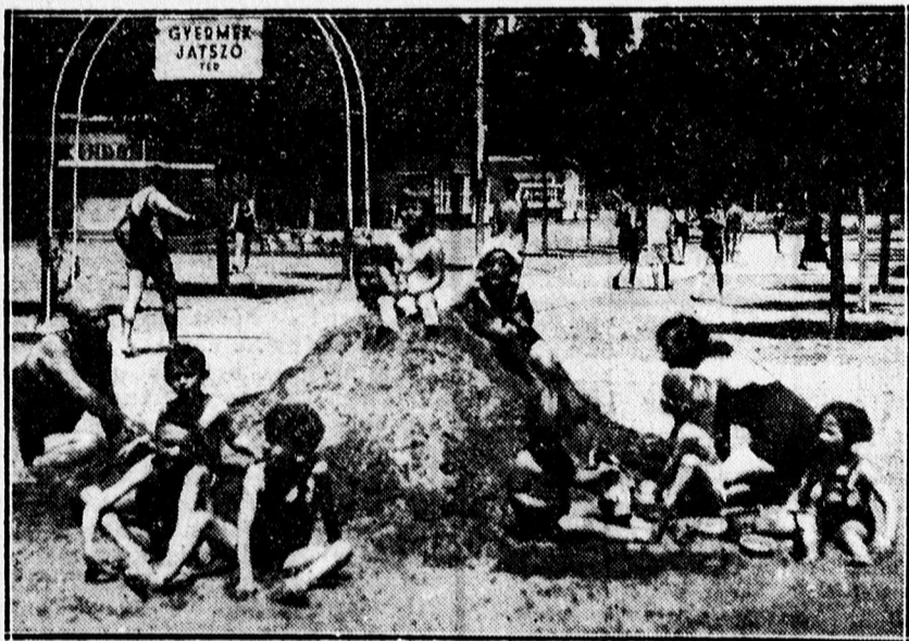
Épül a homokvár.

Forrón tűz a nap s bár nincs kánikula, mégis szabályos meleg van. Nincs is okosabb dolog ilyenkor, mint fürödni menni és szinte szánakozva gondolok az irodák, üzletek és műhelyekben izzadóakra, akik elfoglaltságuk miatt hétköznap csak sóvárogva gondolhatnak a strand hűs vizére és üdítő levegőjére. Kint percek alatt megszabadulva a ruházattól már élvezem is az erdőtől övezett gyönyörű strand színes képét. Ahogy végignéz az ember a hidegvízű medence kétoldalán húzódnó kabinok ajtajain, melyek élénk színekben ragyognak s a felettük pompázó rózsaszínű muskátlik ezerein, a heverőpadok tarka napernyőin, a kék égen és a mindezt visszatükröző kristályosan csillogó vizen, nincs az a búskomor lélek, aki ezen a színpompás úde látványon fel ne derülne. Nem is látni itt szomorú arcokat. Hangos kacagás, kergetőzés, ugrálás és vidám uszálás zaja keveredik a rádió cigányzenéjének hangjaival és tölti be a levegőt. Bár kőnap van, mégis mintegy kétezer ember van kinn.